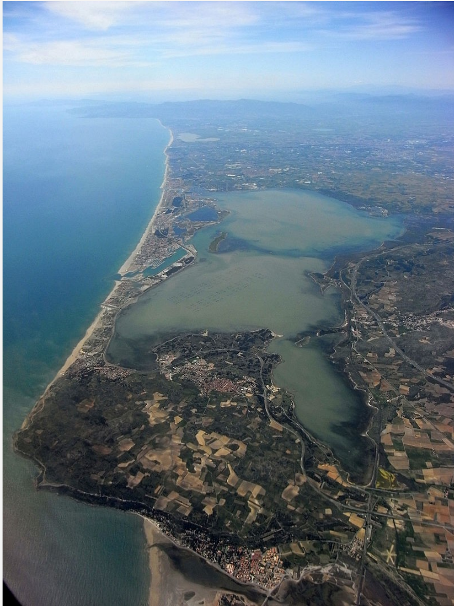
L'estany de Salses