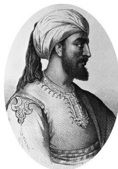
Abd al-Rahmān II

https://upload.wikimedia.org/wikipedia/commons/5/55/Musa_bin_Nusayr_-_%D9%85%D9%88%D8%B3%D9%89_%D8%A8%D9%86_%D9%86%D8%B5%D9%8A%D8%B1.png