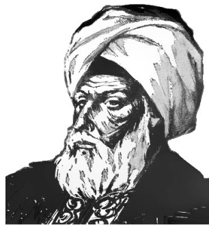
Mussa ibn Nussayr

El 1203 els Almohades van conquerir la Taifa de Mallorca, que va continuar sota el seu domini fins a la seva incorporació a la Corona d'Aragó després de la conquesta catalana.