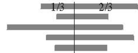
Sazba na mimostřednou osu