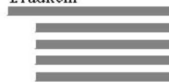
Sazba s předsazeným 1 řádkem