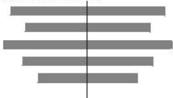
Sazba na osu