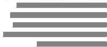
Sazba na praporek (zprava)