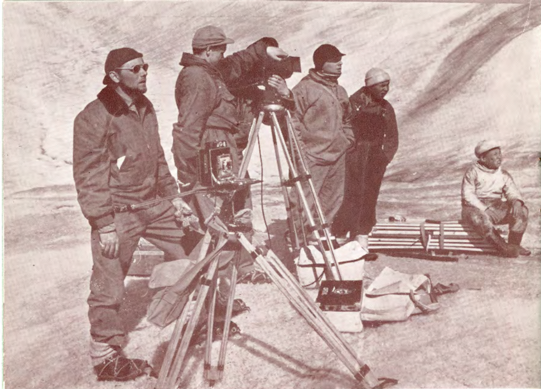
Instruktør og fotografer på indlandsisen.