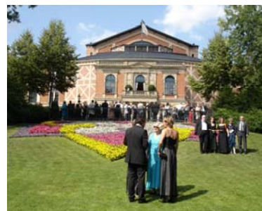
© Bayreuth Marketing & Tourismus GmbH