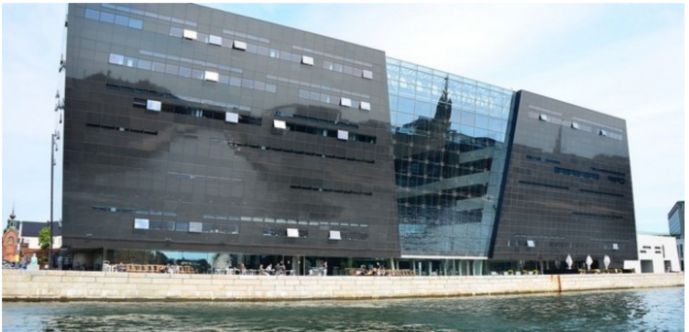
Denmark's Royal Library