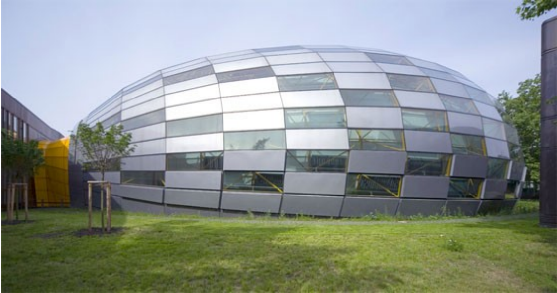
Philologischen Bibliothek für die FU Berlin von Norman Foster; Wie ein Ballon spannt sich die Fassade über das Innere und dockt an den Altbau mit dem Spitznamen „Rostlaube“ an; Foto © Reinhard Görner