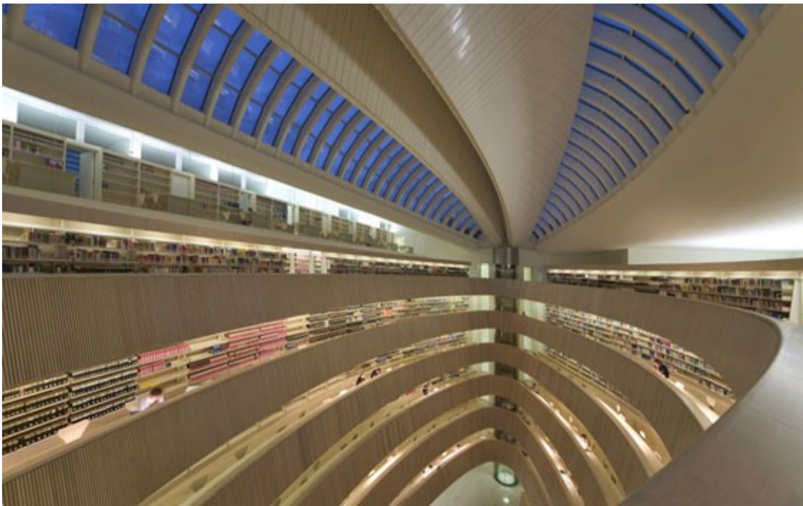
Bibliothek des Rechtswissenschaftlichen Institutes Zürich von Santiago Calatrava, 2005