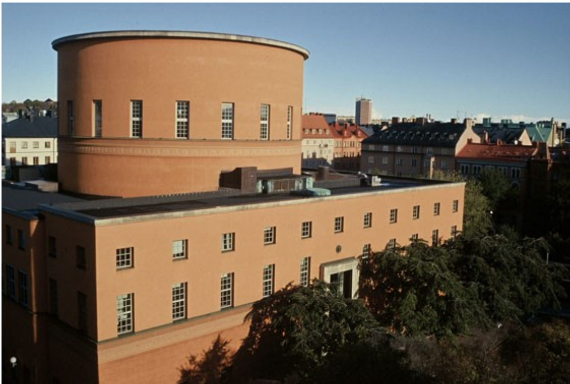
Stadsbiblioteket Stockholm von Gunnar Asplund, 1928