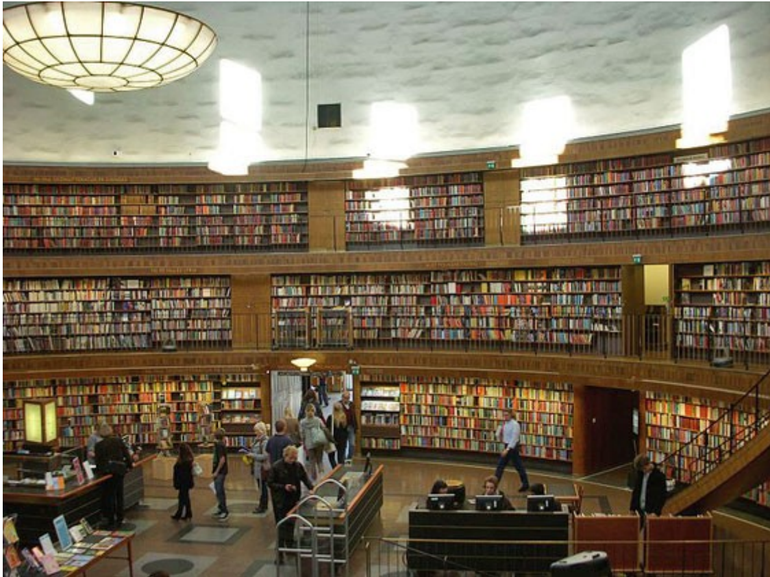
Stadsbiblioteket Stockholm von Gunnar Asplund, 1928