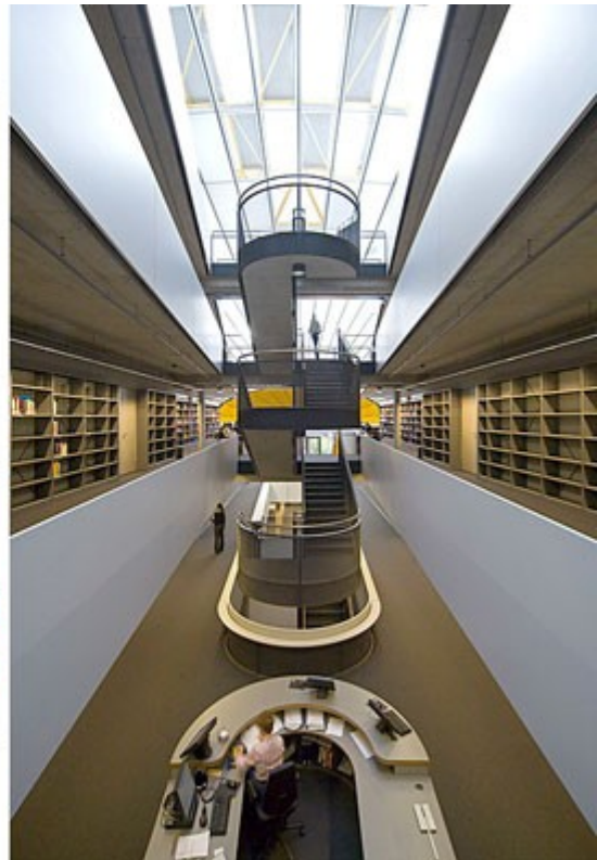
Philologischen Bibliothek für die FU Berlin von Norman Foster