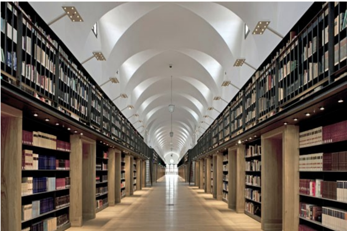
Bibliothek Manica Lunga umgebaut von Michele De Lucchi, Foto Alessandra Chemollo, © Fondazione Giorgio Cini