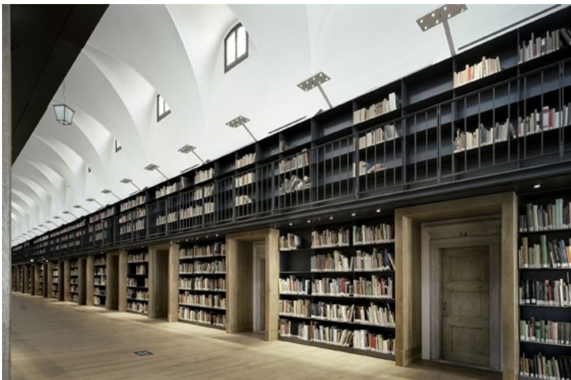
Bibliothek Manica Lunga umgebaut von Michele De Lucchi