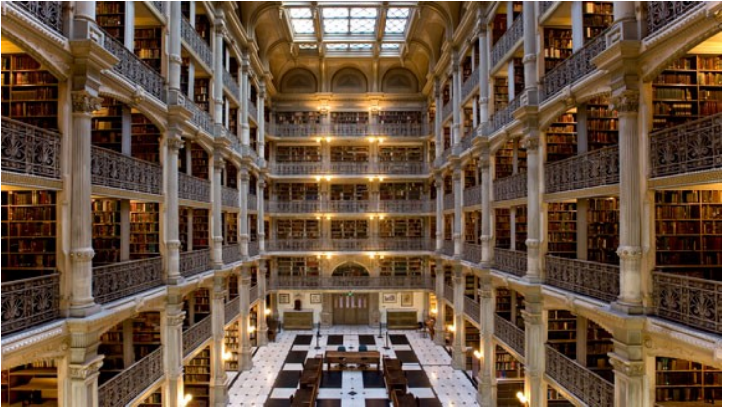
George Peabody Library, Johns Hopkins University, Baltimore