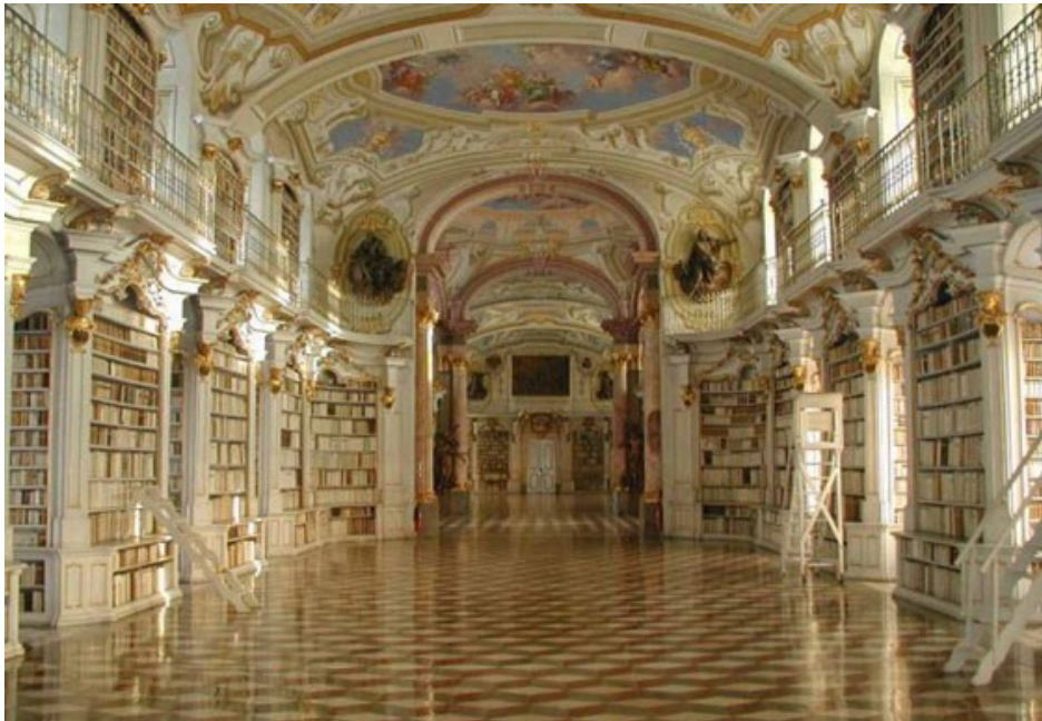
Bibliothek des Benediktinerstiftes Admont aus dem Spätbarock