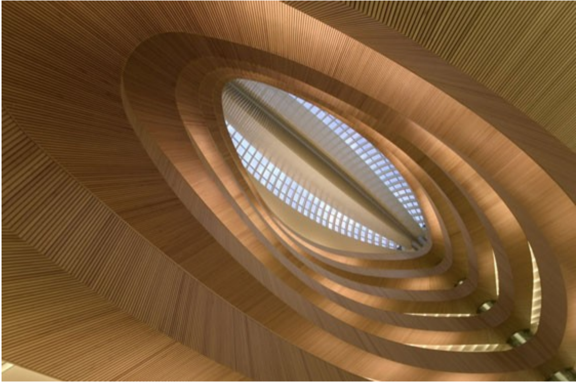
Bibliothek des Rechtswissenschaftlichen Institutes Zürich von Santiago Calatrava, 2005 © Ralph Richter/archenova