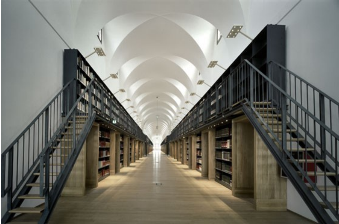
Bibliothek Manica Lunga, Ausgang zur Galerie, umgebaut von Michele De Lucchi, Foto Alessandra Chemollo, © Fondazione Giorgio Cini