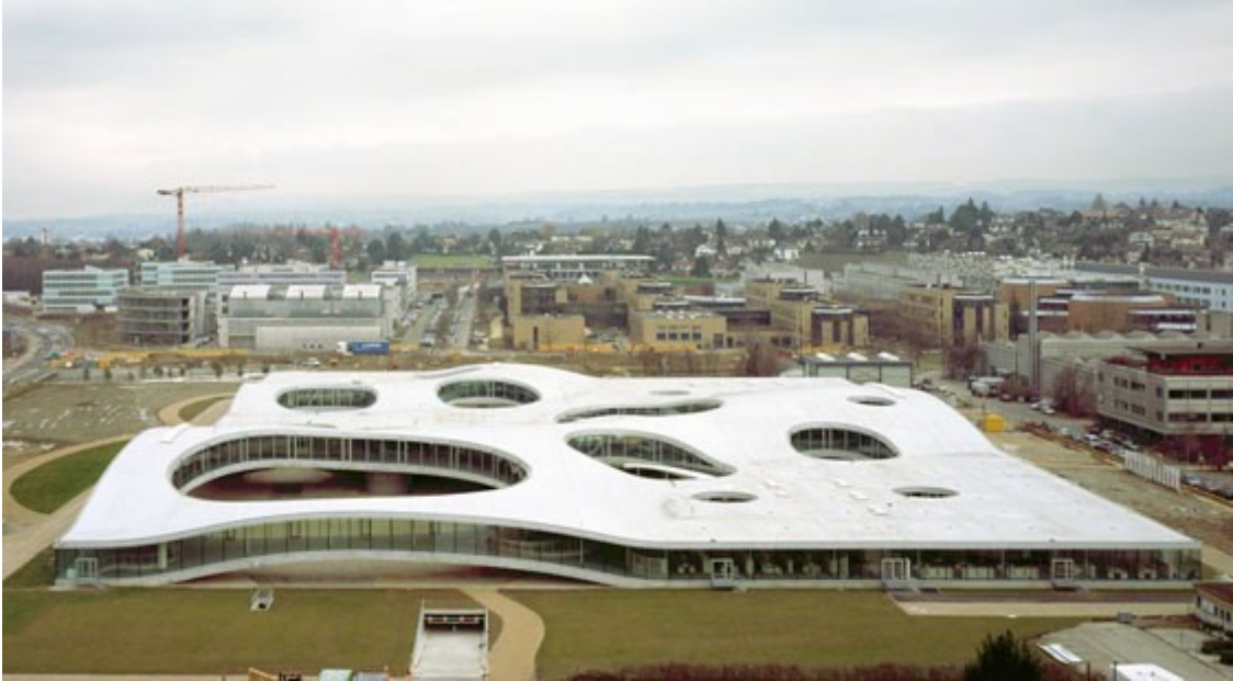
Luftaufnahme des 2010 eröffneten Rolex Learning Centers der Ecole Polytechnique Fédérale de Lausanne von Sanaa