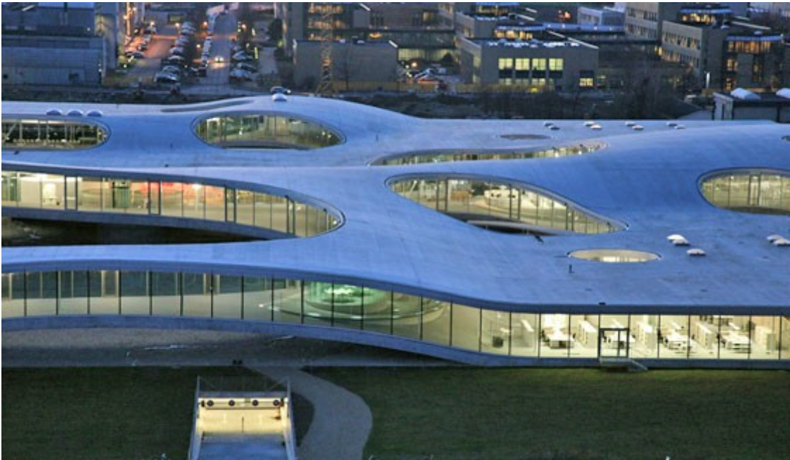
Wellenförmige Dachlandschaft mit zahlreichen Oberlichtern des Rolex Learning Centers von Sanaa