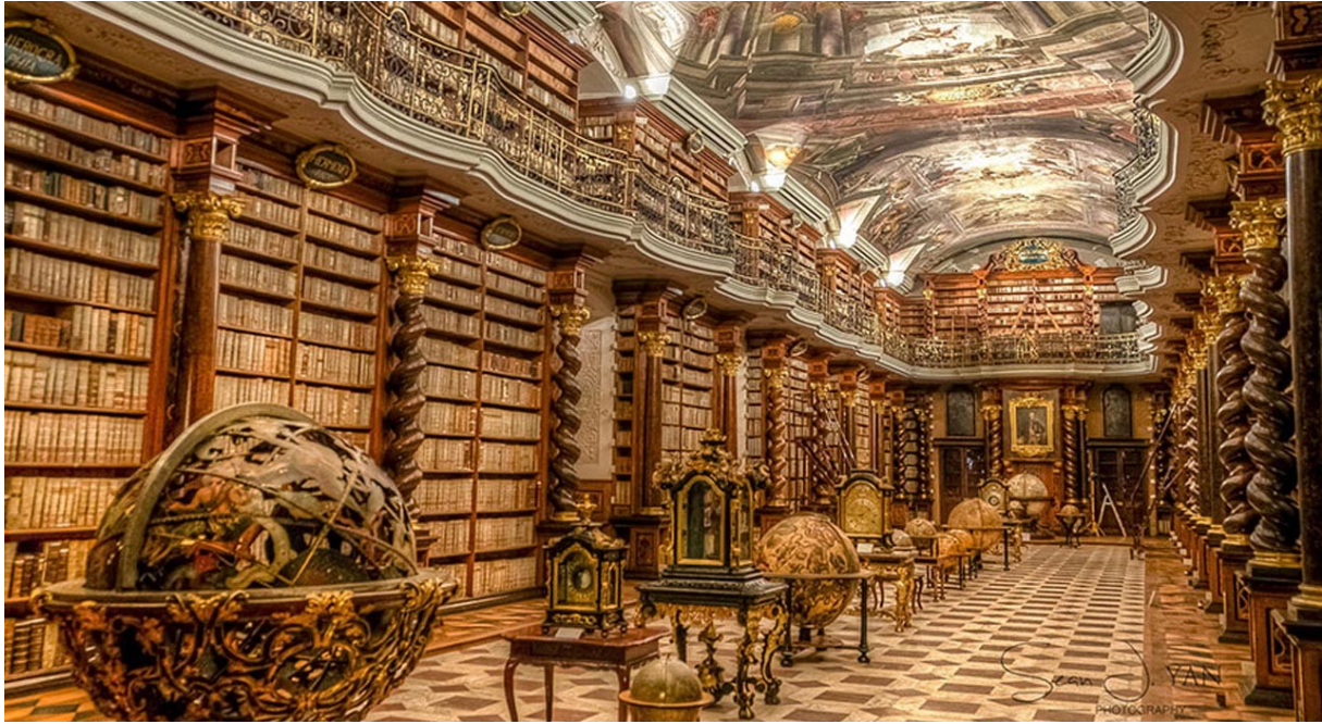
Clementinum – Prag