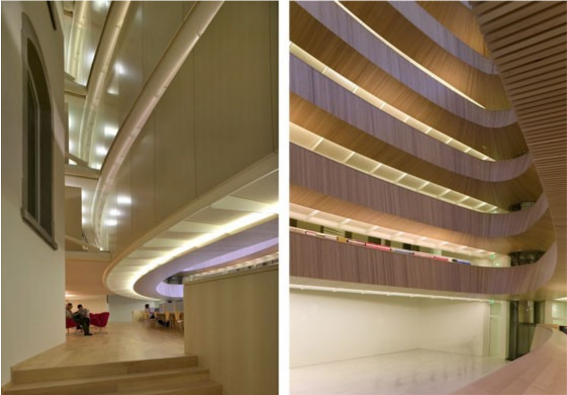
Bibliothek des Rechtswissenschaftlichen Institutes Zürich von Santiago Calatrava, 2005