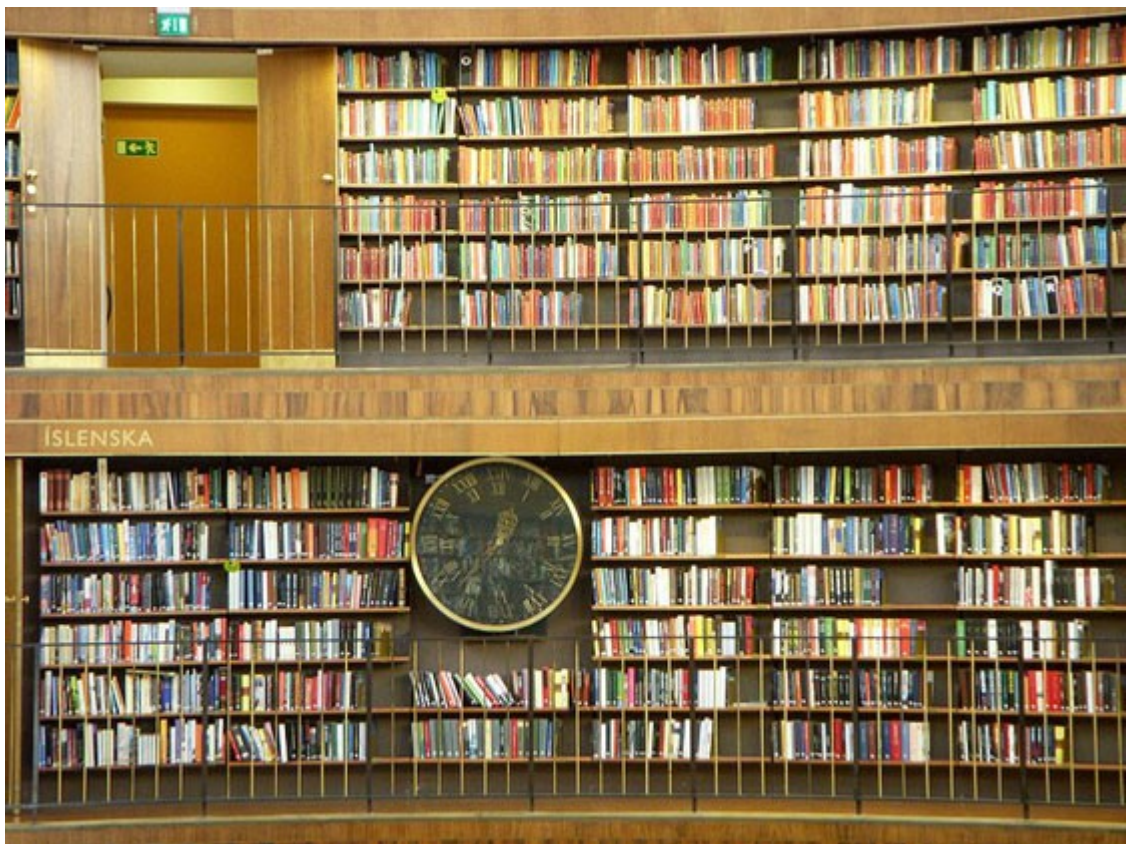
Stadsbiblioteket Stockholm von Gunnar Asplund, 1928