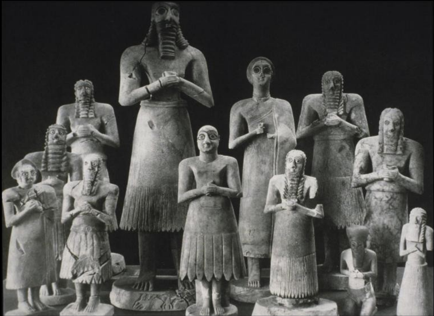
Votive statuettes from the Square Temple, Eshnunna ca. 2700-2600 B.C.E. Near Eastern (Sumerian) 3500 BCE-330 BCE