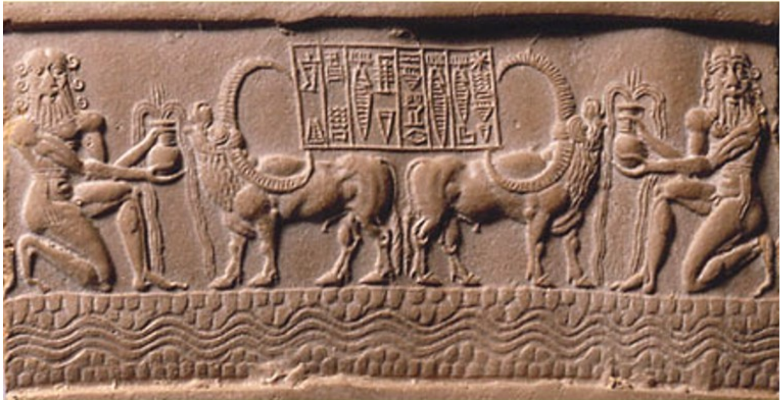
Seal of Ibni-Sharrum, the scribe of King Sharkali-Sharri son of Naram-Sin - 2,250 B.C.