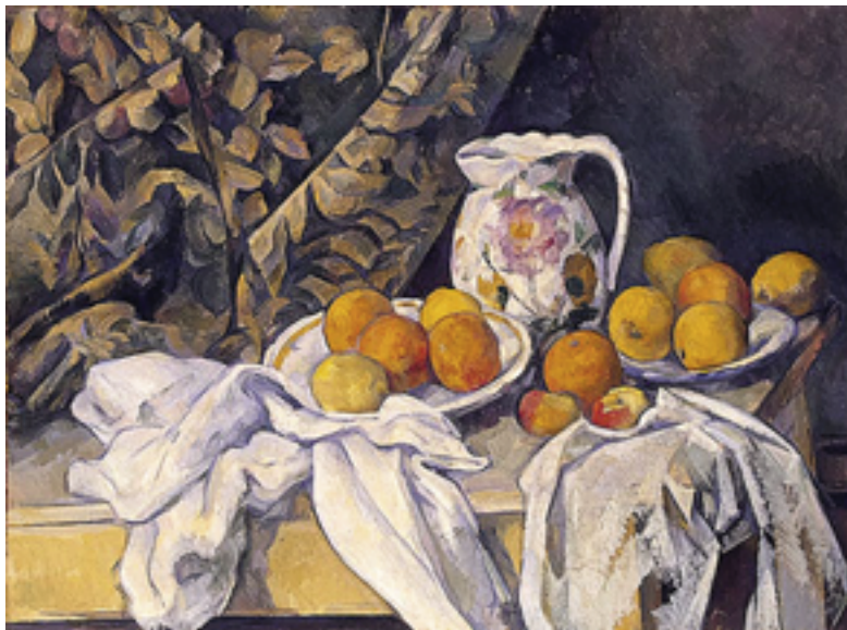
Paul Cézanne, Martwa natura z jabłkami i pomarańczami