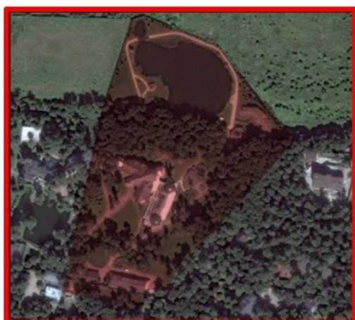
Усадьба в Знаменском (4га) Принадлежит фонду «Соцгоспроект»