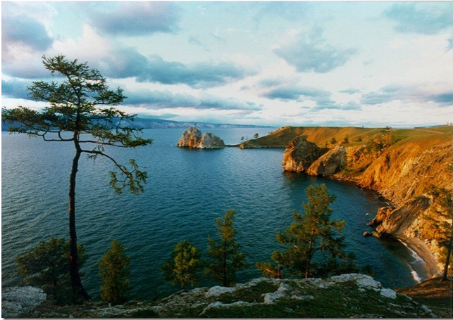
озеро Байкал – 1642 метра