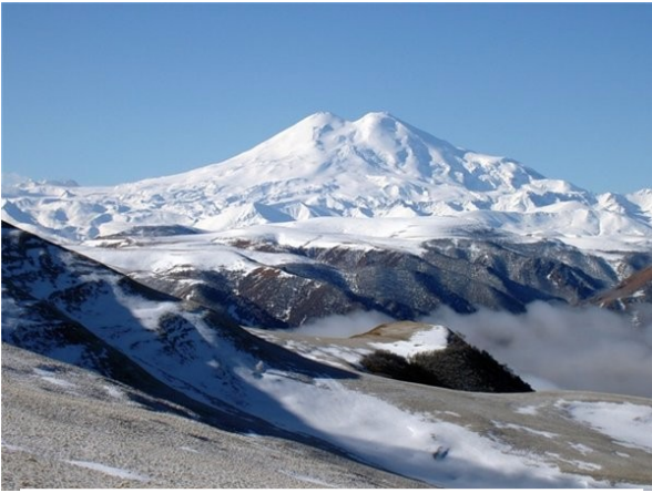
гора Эльбрус – 5642 метра