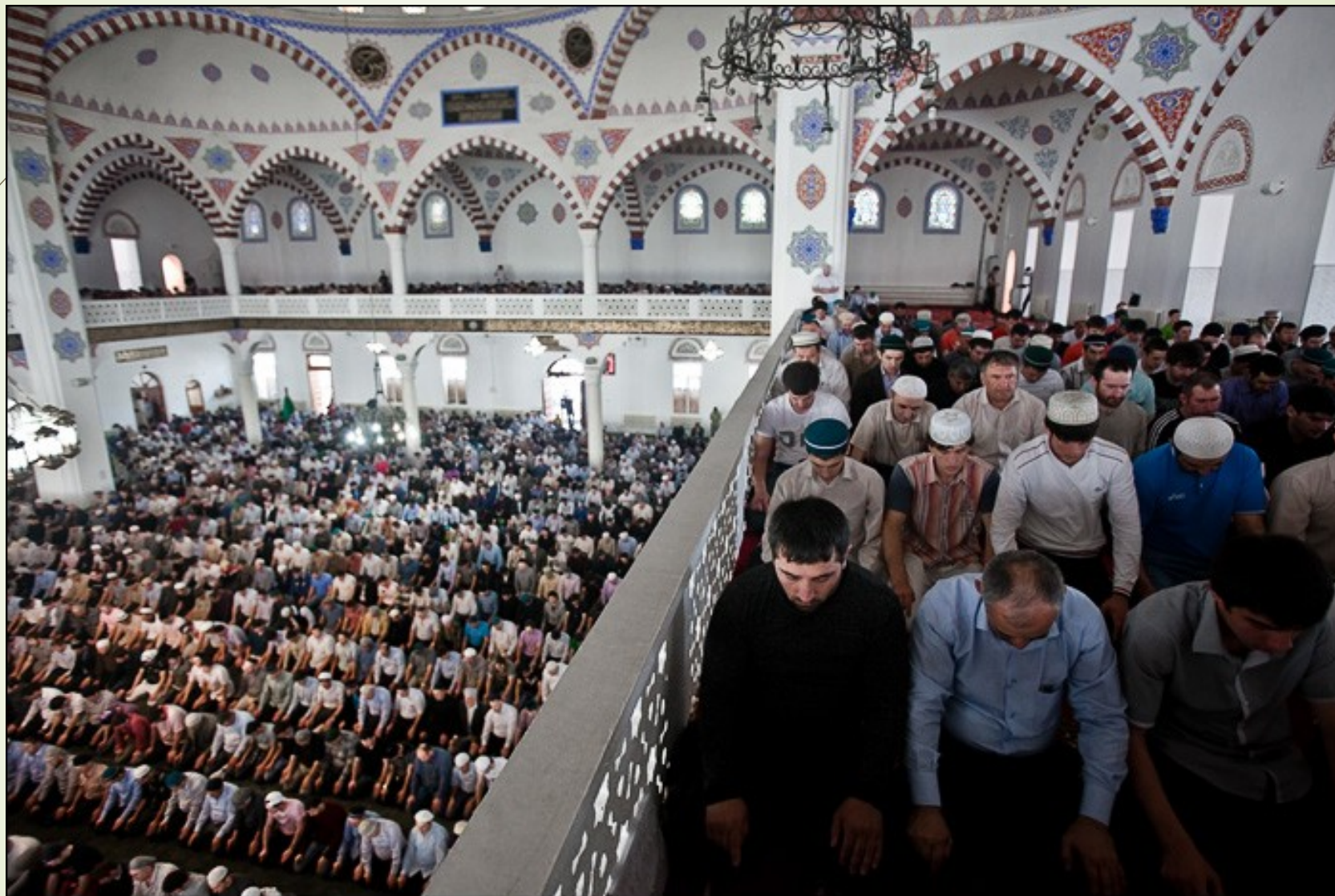
Верующие в мечети