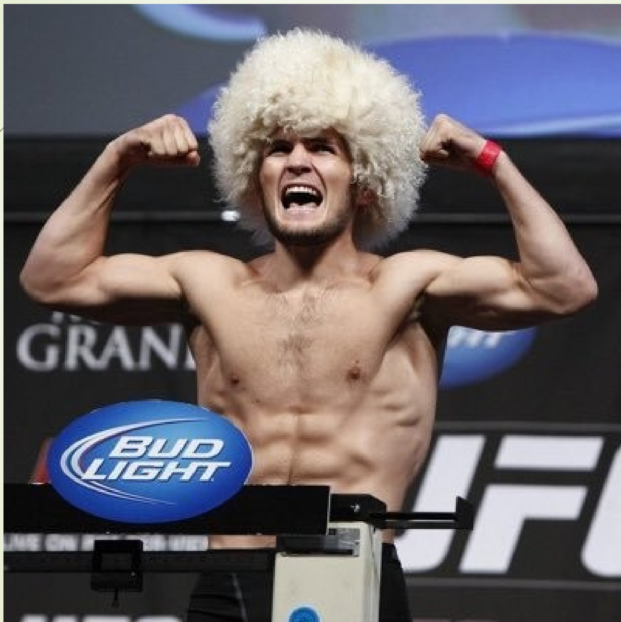
Хабиб с папахой на голове