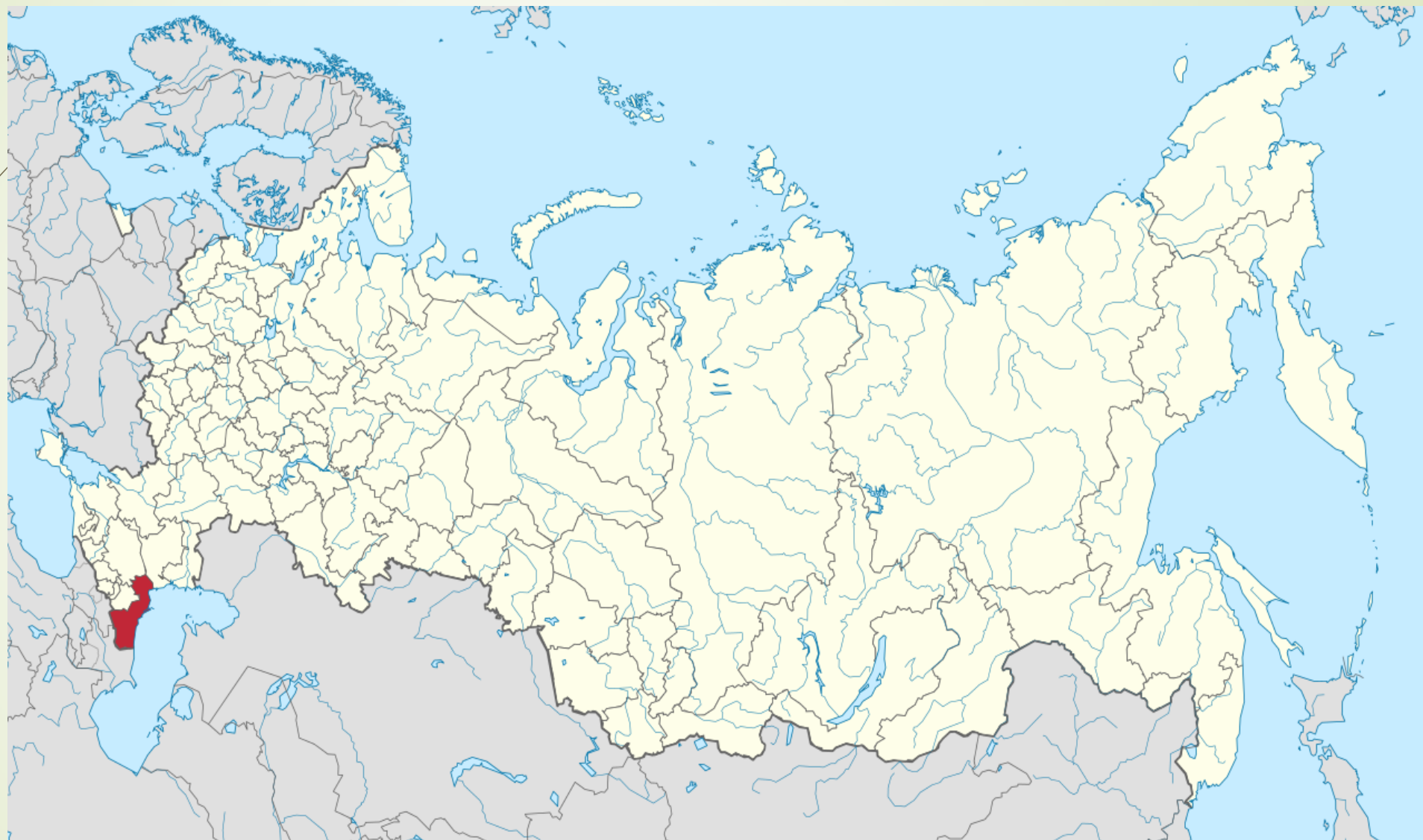
Дагестан на карте России