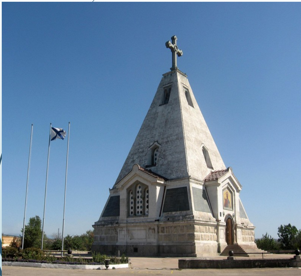
CHRÁM SV. MIKULÁŠE