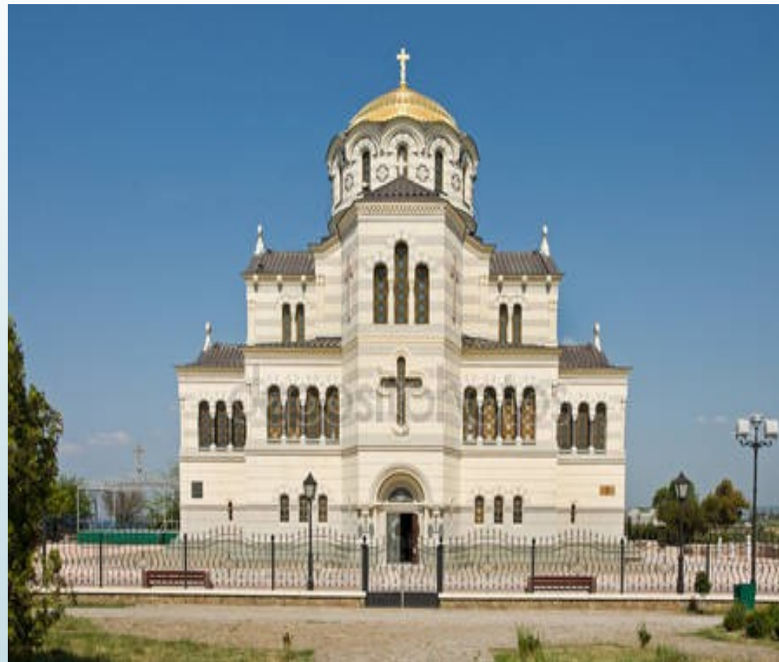
CHRÁM SV. VLADIMÍRA