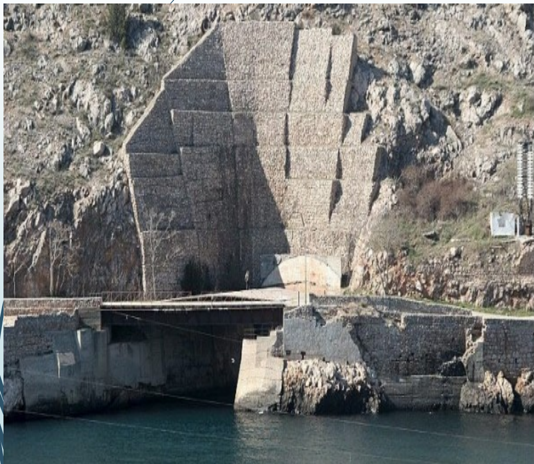
PODZEMNÍ ZÁKLADNA PONOREK BALAKLAVA