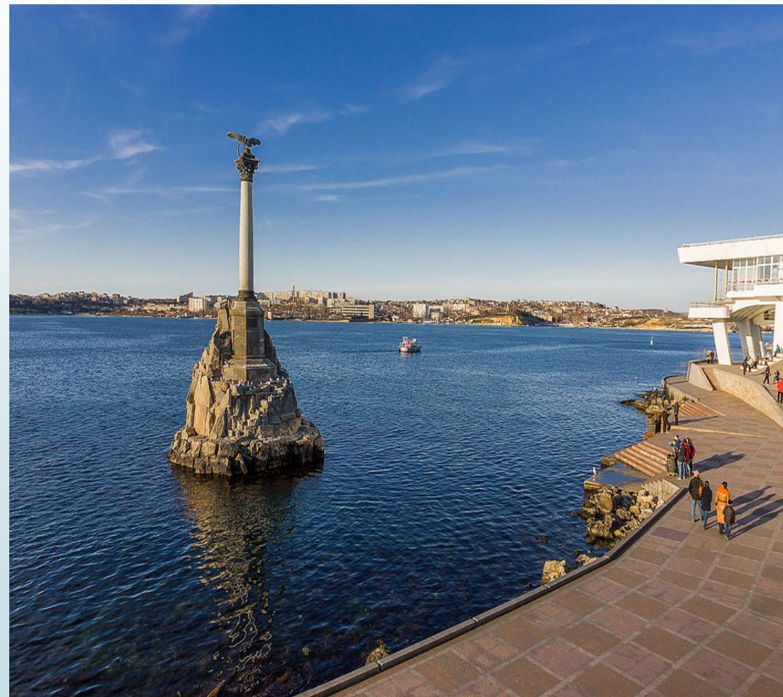
POMNÍK POTOPENÝM LODÍM