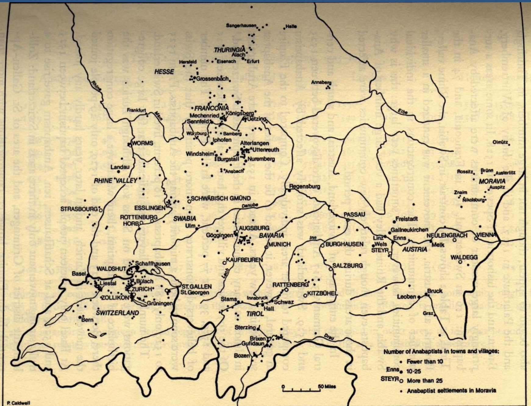
1. Anabaptism in Towns and Villages, South and Central Germany, Switzerland and Austria, 1525-1529