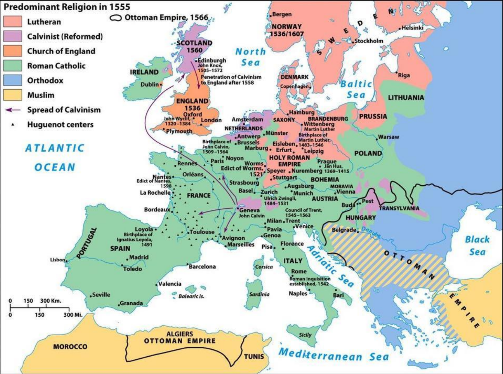
Map 14.2 Religious Divisions in Europe Chapter 14, Western Society: A Brief History Copyright © 2010 by Bedford/St. Martin's Page 358