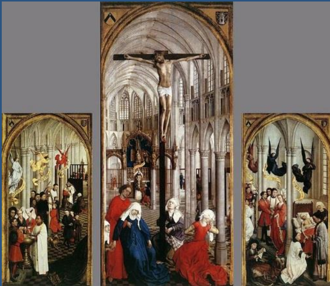
Rogier van der Weyden, cca 1443