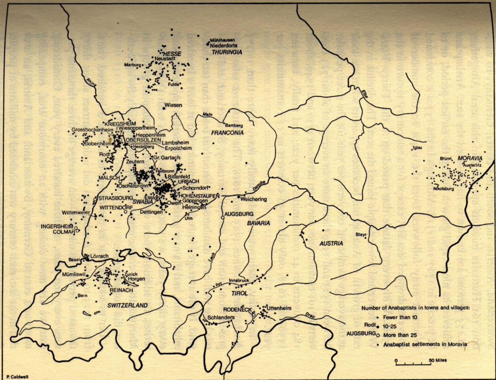
3. Anabaptism in Towns and Villages, South and Central Germany, Switzerland and Austria, 1550-1618