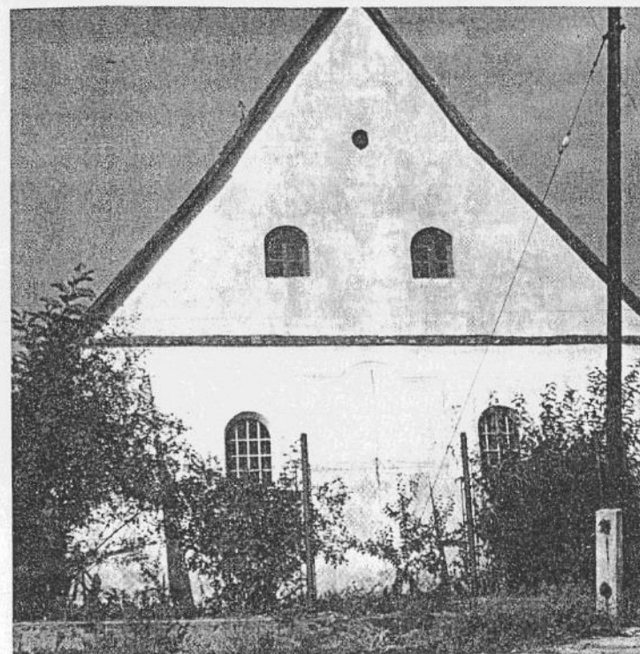
Figure 15. Top , house in Altenmarkt Bruderhof, founded in 1545, today near Břeclav, Slovakia (Photograph, 1970); bottom , gable of Hutterite dwelling at Grosschützen (Velké Leváry), Slovakia. (Photograph, 1970)