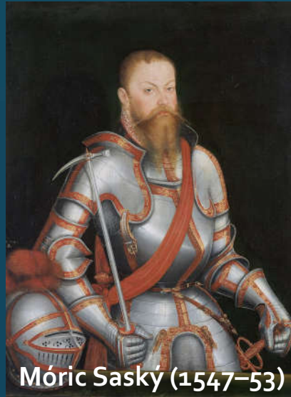
Móric Saský (1547–53)