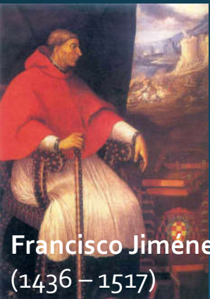
Francisco Jiménez de Cisneros (1436 – 1517)