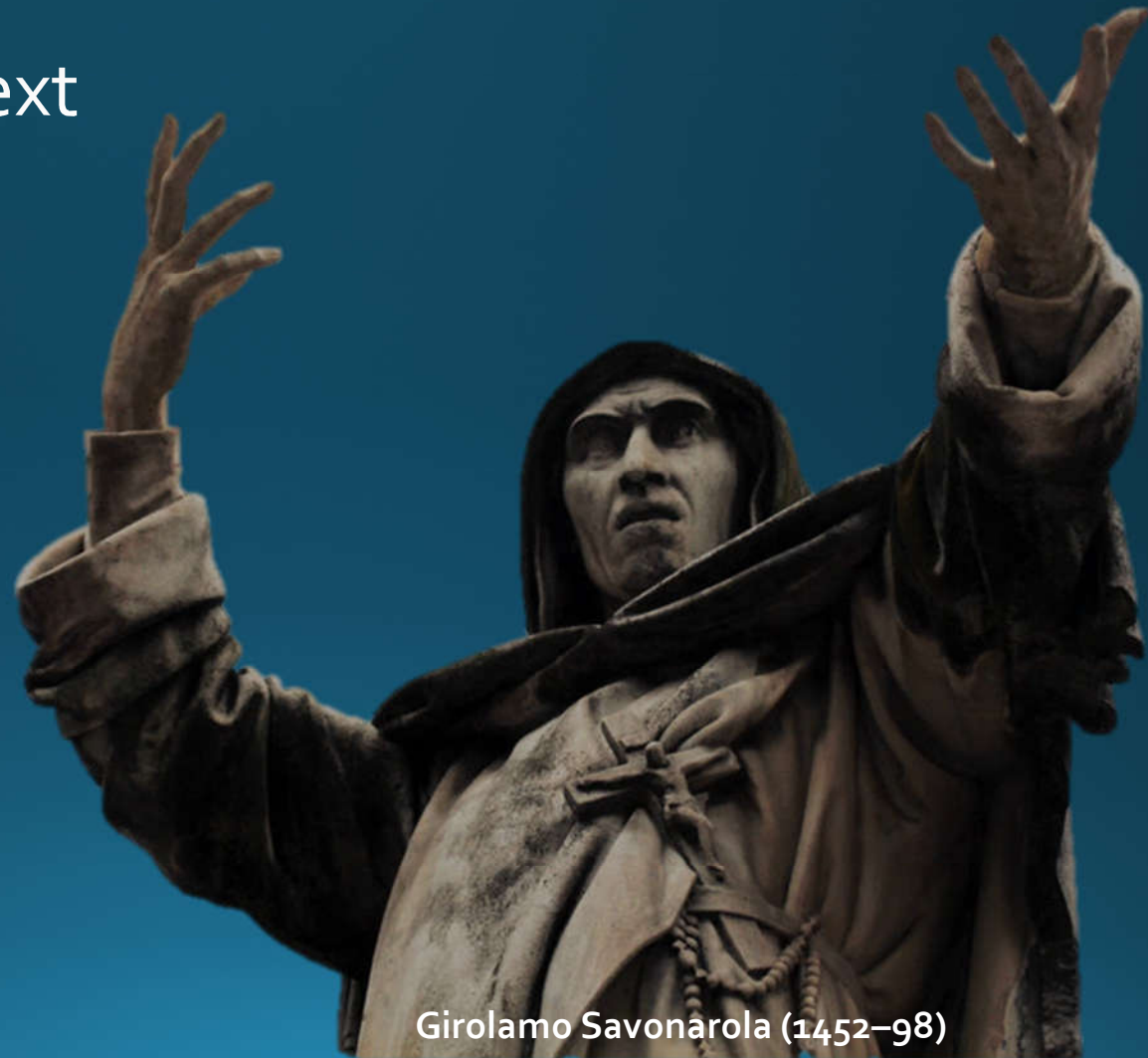
Girolamo Savonarola (1452–98)