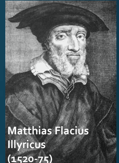
Matthias Flacius Illyricus (1520-75)

1608 (-1621) Protestantská únia 1609 Katolícka liga