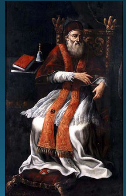
Pavol IV. (1555 – 1559)