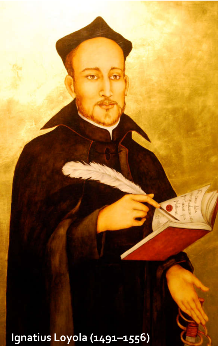
Ignatius Loyola (1491–1556)