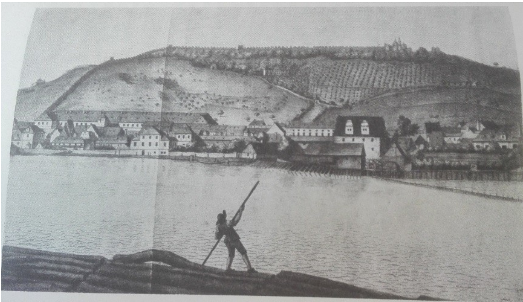
Starý pohled na Sovovy mlýny na Kampě. (Detail z kolorovaného mědirytu a leptu Jos. Gregoryho podle busty Lud. Kohla)