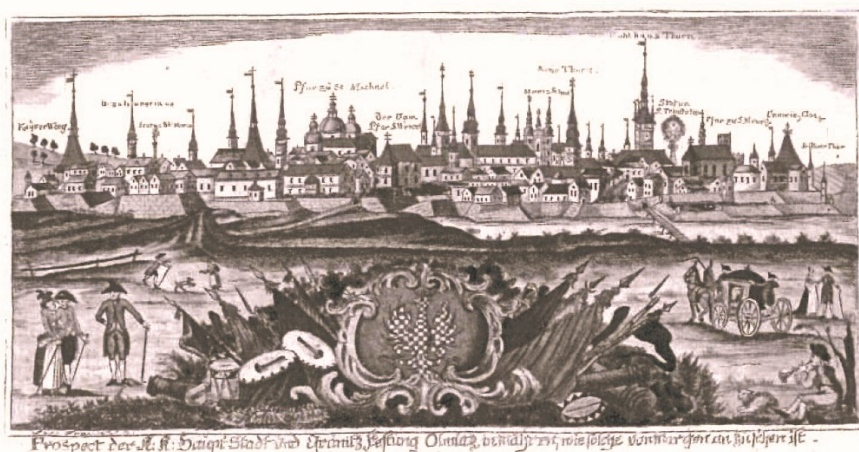
140 Veduta Olomouce, kolem poloviny 18. století, rytina. Státní okresní archiv Olomouc.

a o tom, jaké způsoby patronátních aktivit vyvíjeli? Ke konci 18. století kritické osvícenské zprávy mluví spíše o maloměstské životní kultuře místní aristokracie. 91