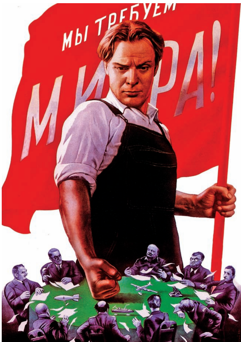
Sovětský propagandistický plakát hlásá: Žádáme mír!