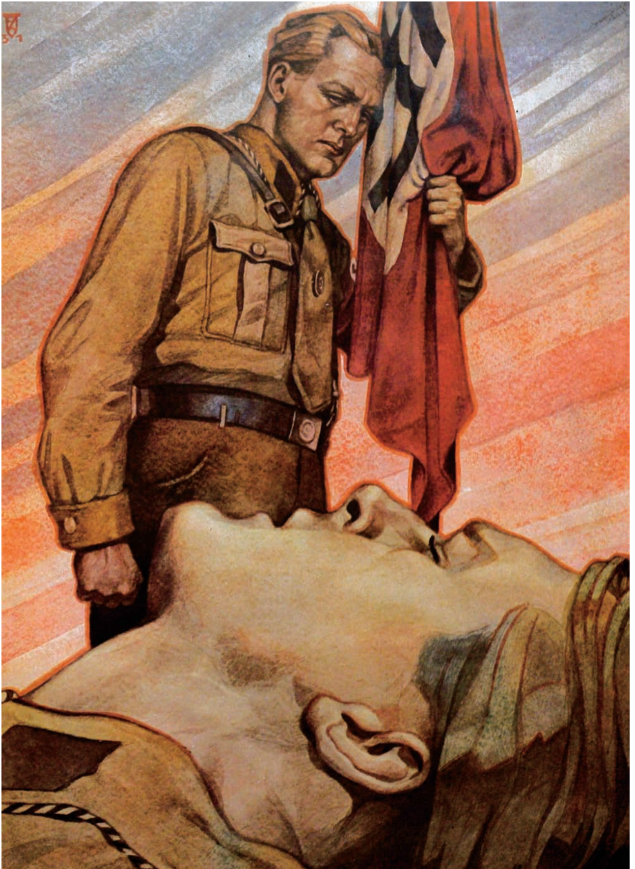
Padlý soukmenovec. Podobný motiv mívala i díla socialistického realismu.