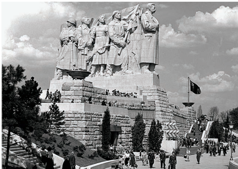
Pomník J. V. Stalina na pražské Letné

Nešlo ovšem o žádnou legraci. Umělce bylo možno zlikvidovat za slovesné, hudební, výtvarné či jiné dílo, pokud nebylo „lidové“, „nevycházelo ze socialistické skutečnosti“, „nebralo na vědomí život pracujících“, „nezabývalo se problémy současnosti“ či „nestálo na jasných třídních pozicích marxismu-leninismu“. Takové umění bylo „formální“, „formalistické“, „odcizené lidu“, „protiidové“, prostě škodlivé. Moderní poklady Tretjakovské galerie ležely kdesi