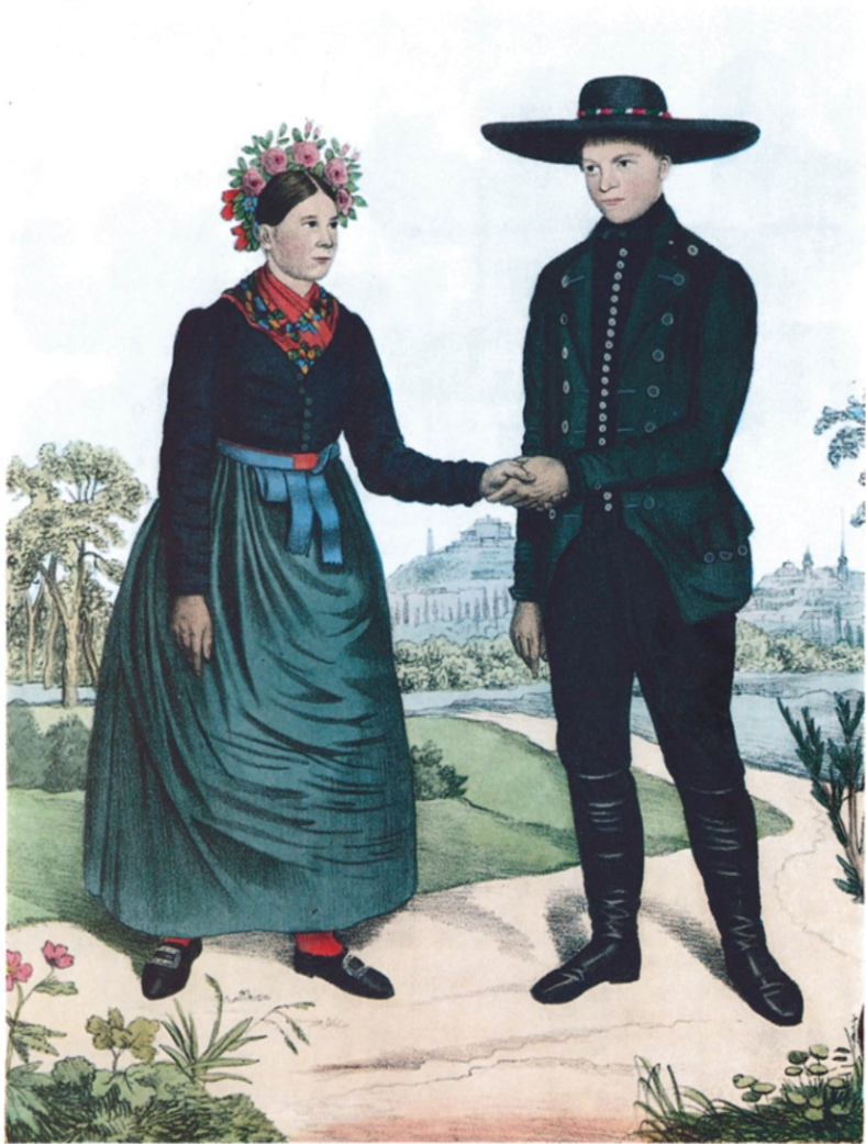
SVOBODNÝ PÁR Z KOMÁROVA