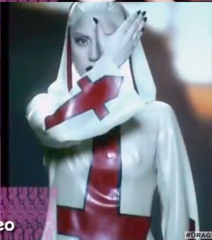
Farrah Moan Alejandro Music Video