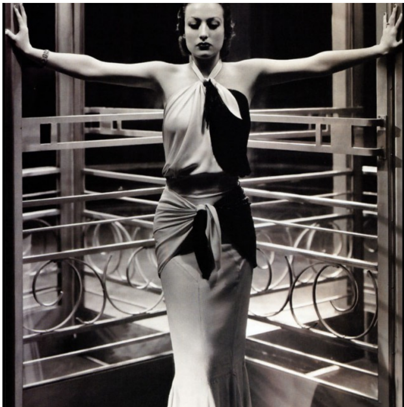
Kontrastní asymetrické šaty