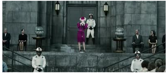
Obr. 4: Detaily