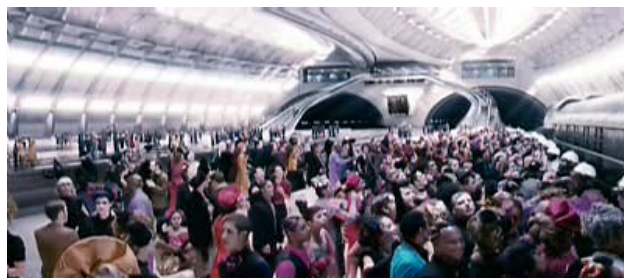
Obr. 6: Represivní systém