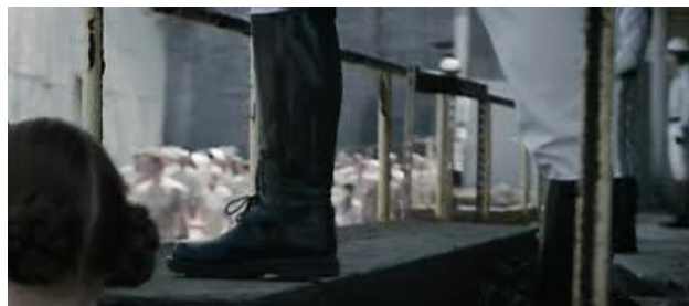
Obr. 7: Oblékání ve Dvanáctém kraji