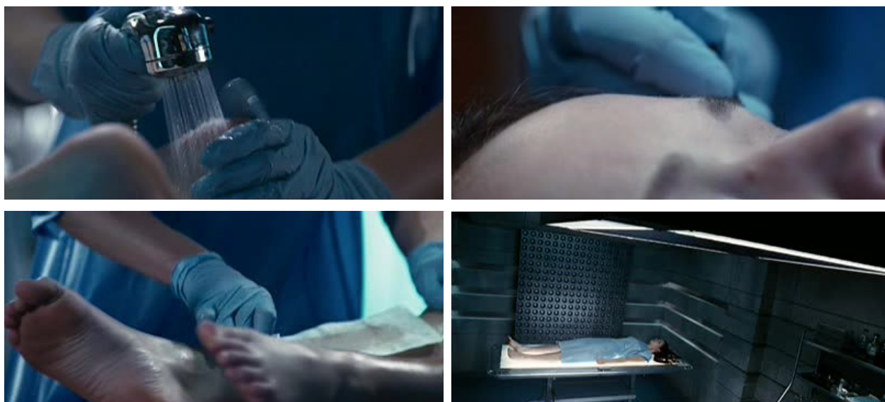
Obr. 11 – Jennifer Lawrence a její image cool girl