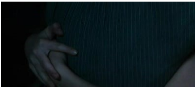
Obr. 1: První objevení Katniss ve filmu