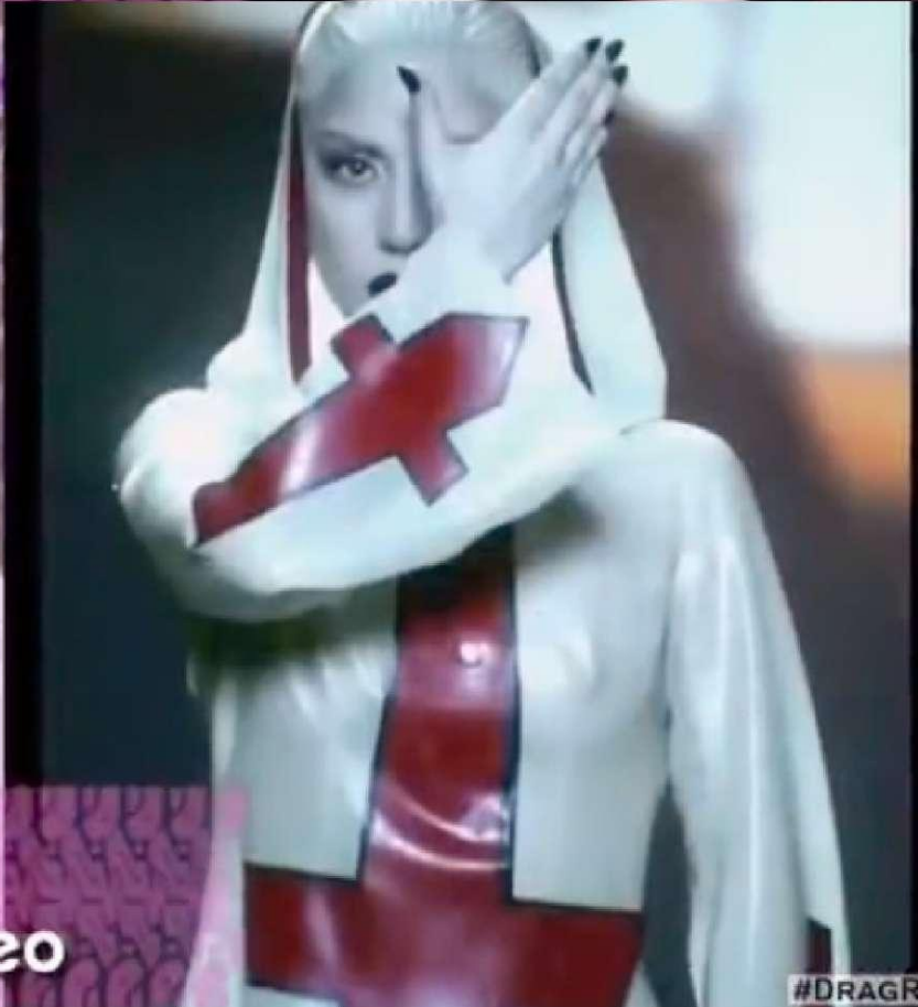
Farrah Moan Alejandro Music Video