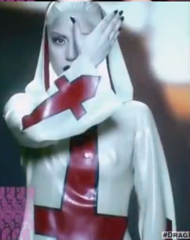
Farrah Moan Alejandro Music Video