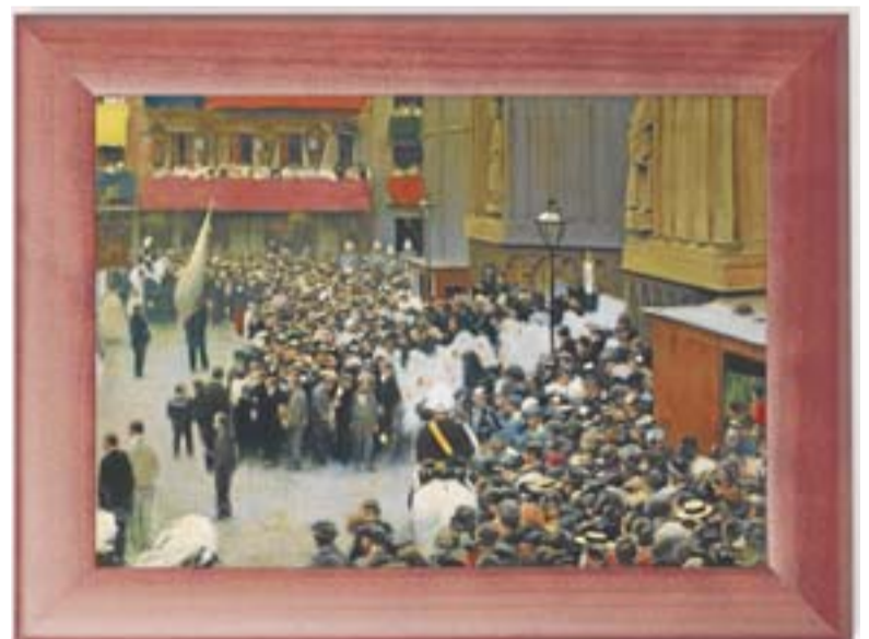
Diumenge, 20 La sortida de la processó de Corpus Museu Nacional d'Art de Catalunya