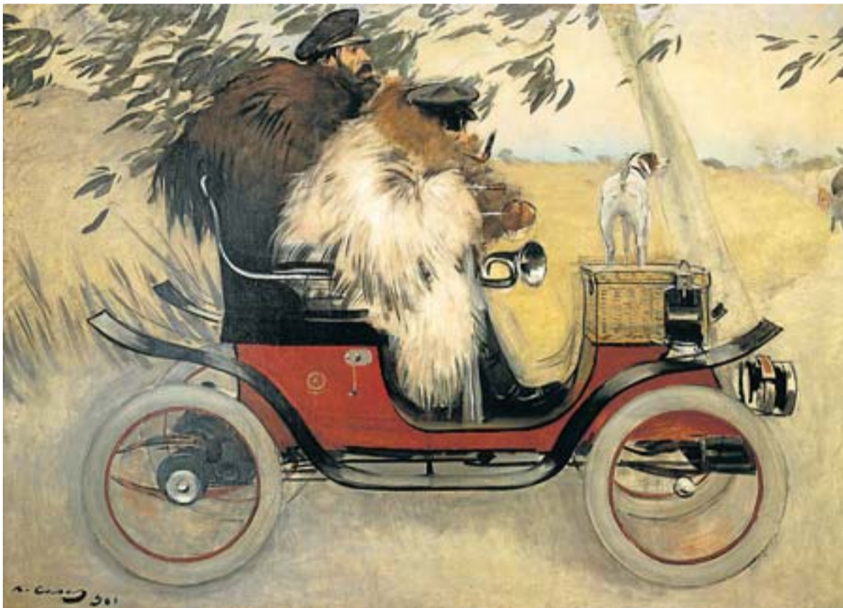
Ramon Casas i Santiago Rusiñol, dalt del cotxe, van ser vocals de l'Automòbil Club d'Espanya.