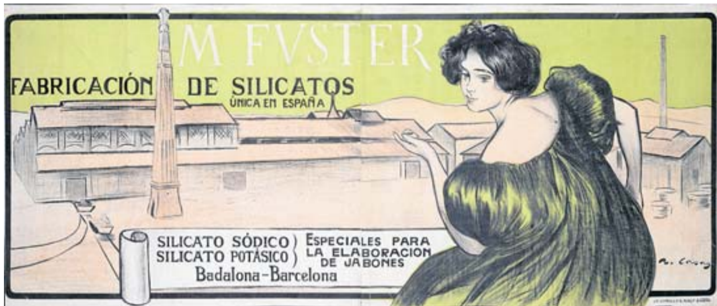
La imatge elegant de la indústria en aquest cartell de Ramon Casas contrasta amb la conflictivitat laboral de l'època. MNAC