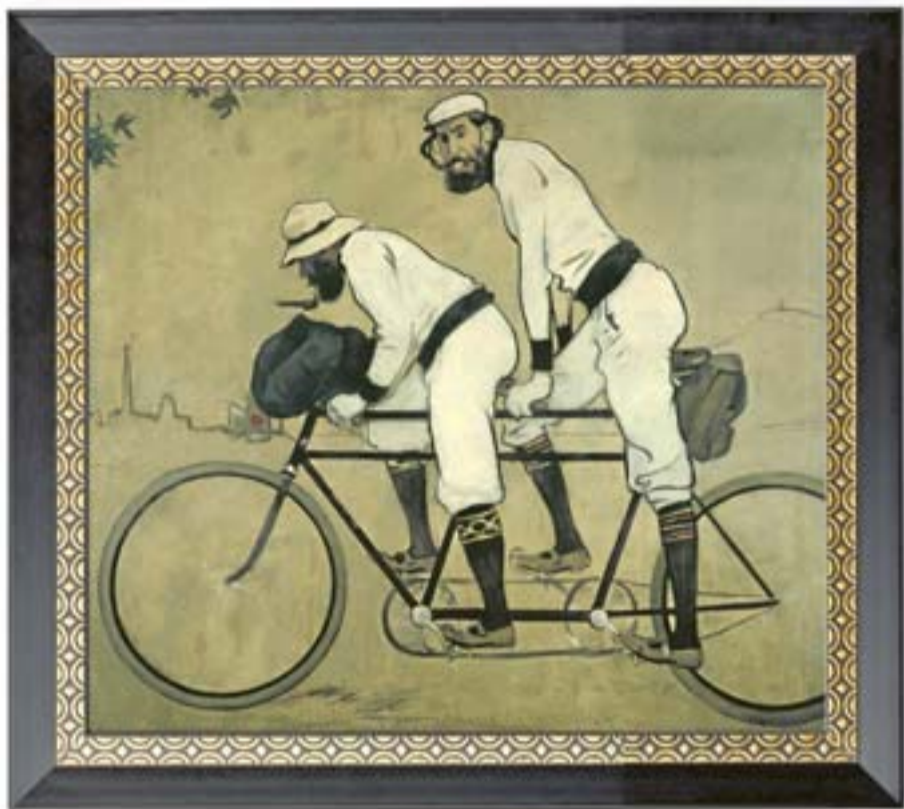
Diumenge, 13 El tàndem