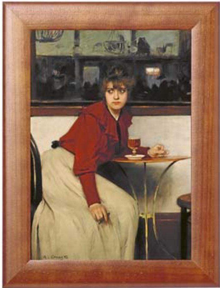
Dijous, 17 Madeleine Museu de Montserrat