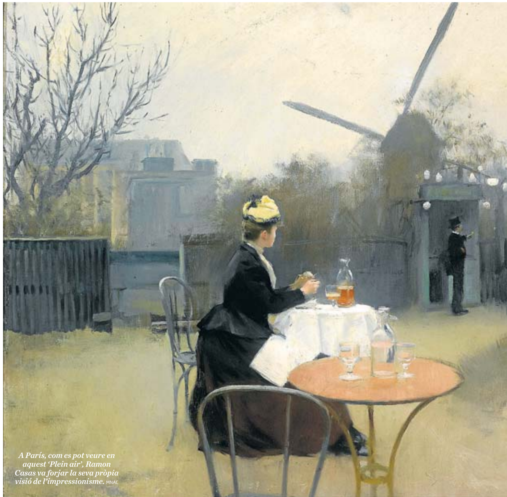
A París, com es pot veure en aquest 'Plein air', Ramon Casas va forjar la seva pròpia visió de l'impressionisme. MNAC

Durant aquestes primeres dècades de la vida de Ramon Casas es construeix una de les icones arquitectòniques de Barcelona,