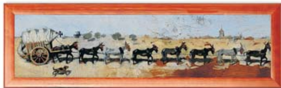
Dimecres, 16 Carro amb vuit mules de tir Museu del Cau Ferrat