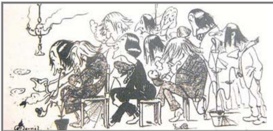
Visió dels modernistes que tenia el dibuixant Gaietà Cornet.