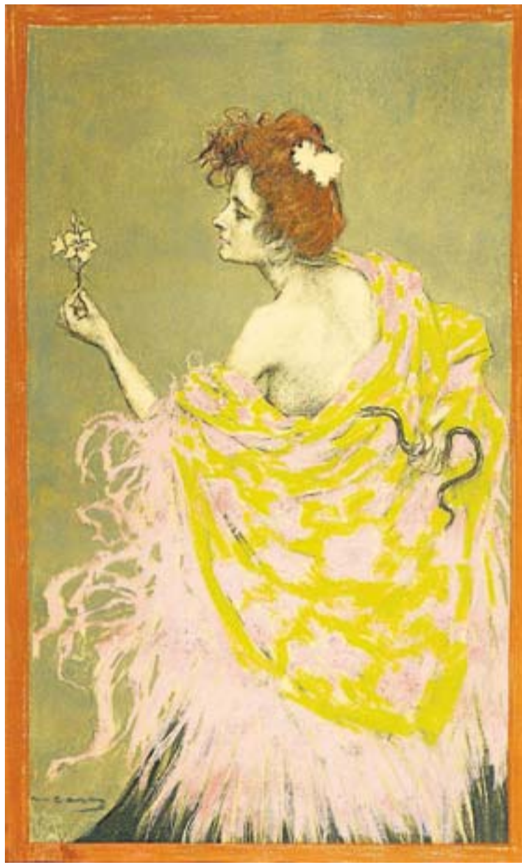
Tot i que va tenir una visió progressista de la dona, en un cartell de l'any 1900 Ramon Casas va advertir els homes dels riscos de la sífilis amb aquesta dona demacrada.