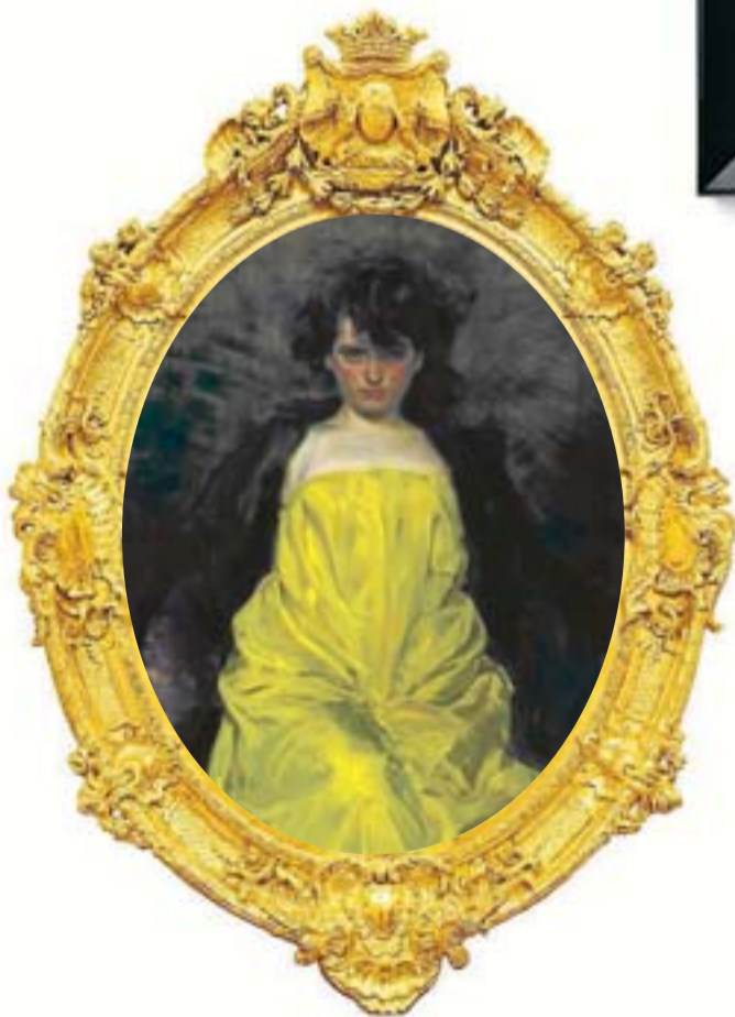
Dissabte, 19 La Sargantain Cercle del Liceu