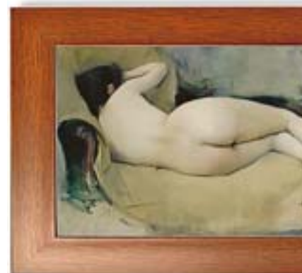
Dimarts, 15 Nu d'esquena Museu del Cau Ferrat