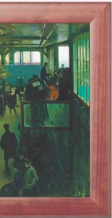
Divendres, 18 Ball al Moulin de la Galette Museu del Cau Ferrat