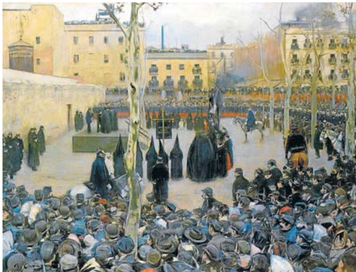
'Garrot vil' és una de les pintures de Casas que reflecteixen la realitat social del seu temps.

No havia sigut fàcil arribar fins aquí. Des de principis del segle XX el problema català era una qüestió de primer ordre per a la política espanyola. Rovira i Virgili escrivia que la política madrilenya era "fortament hostil" a fer cap concessió a les aspiracions de Catalunya i, com que estaven segurs de no haver de tenir-li por, creien poder-la "bufetejar impunement". La Mancomunitat va tenir una vida breu, va desaparèixer amb el cop d'estat de Primo de Rivera del 1923. S'obriria un període fosc, de limitació de llibertats i de repressió que no es tancaria fins a la proclamació de la Segona República, el 14 d'abril del 1931. 🇪🇸