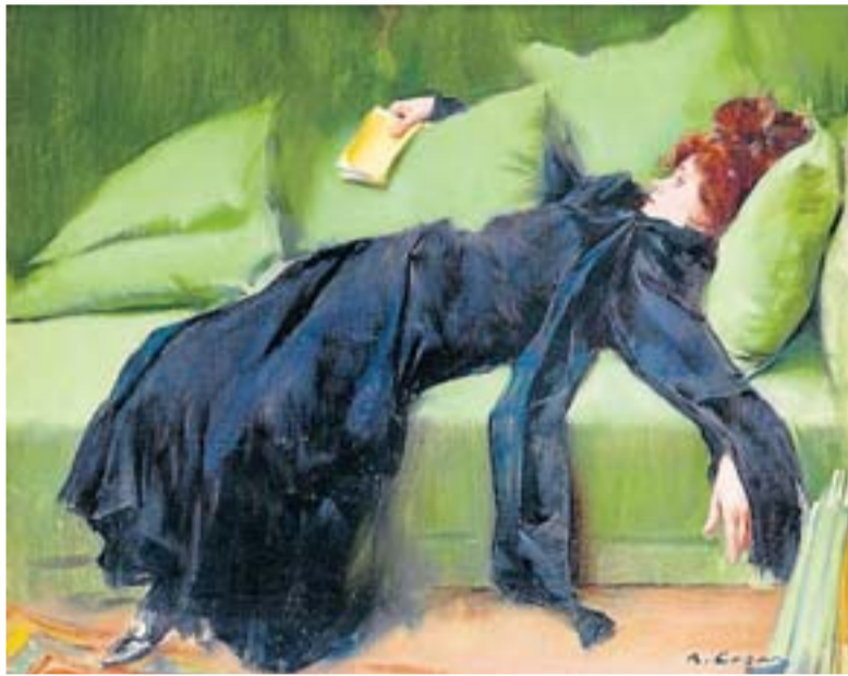
'Jove decadent' representa la mirada menys tòpica de Ramon Casas sobre el món femení. MUSEU DE MONTSERRAT