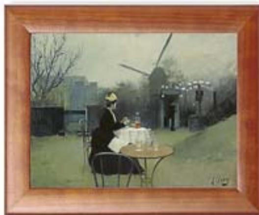
Dilluns, 14 Plein air