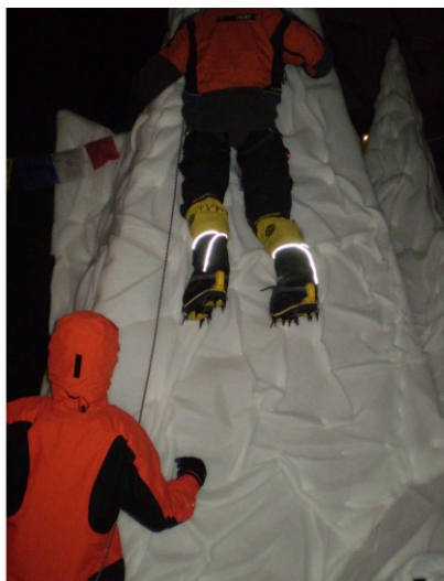
Tygr lidožrout a horolezci zdolávající Himaláje. Zážitky na Vás číhají.