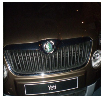
Yeti ve všech podobách. Informační cedule, stopa, automobil.