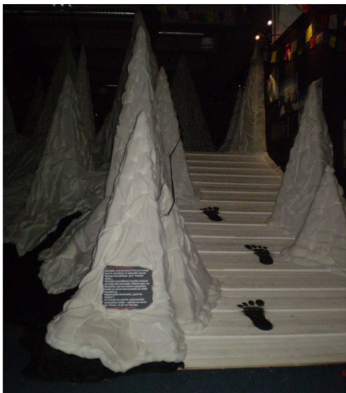
Lahev s vodou přinesená dobrodruhy z Mont Everestu – najdete ji zavěšenou v ledové sluji. Přechod Himalájí s tlapkami sněžného muže.