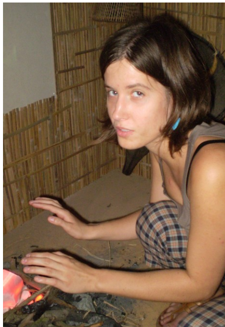
Učení zážitkem? To nezapomenete.

Výstava Šangri-la zkrátka překvapuje. Své návštěvníky inspiruje a zároveň irituje. Provokuje, vyvolává emoce. A informace doprovázená emocí se jak známo lépe ukládá do paměti. Můžete si tedy být jisti tím, že si ze Šangri-la odnesete daleko víc poznatků, než byste čekali. I když zrovna nedosáhnete mystického pohroužení, může být Šangri-la zážitkem, o kterém budete se svými přáteli zaujatě diskutovat ještě dlouho. Možná budete i zvyšovat hlas a výrazně gestikulovat. Rozhodně to ve Vás ale dlouho zůstane. Dlouho.