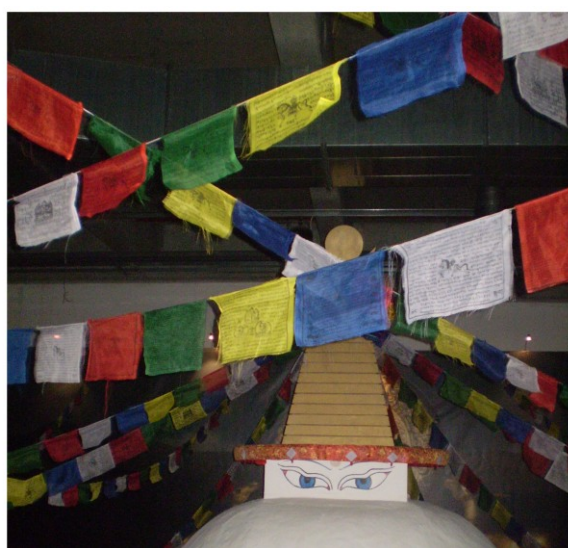
Stan z jačích chlupů a výhled na stúpu. Dva pohledy na Tibet. Který z nich je „autentičtější“? Diskutujme!