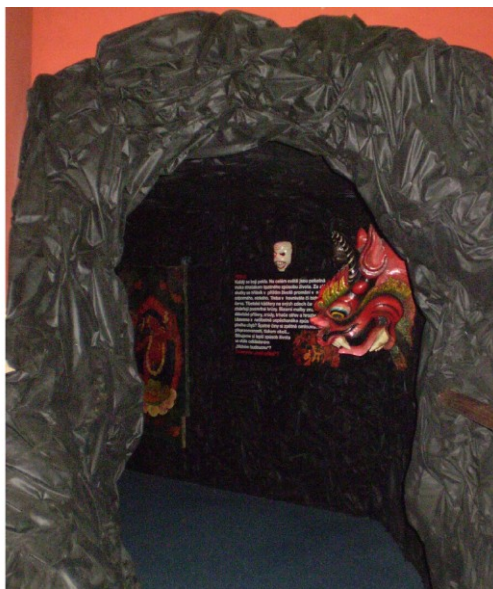
Meditující dalajlama a vstup do tibetského pekla.