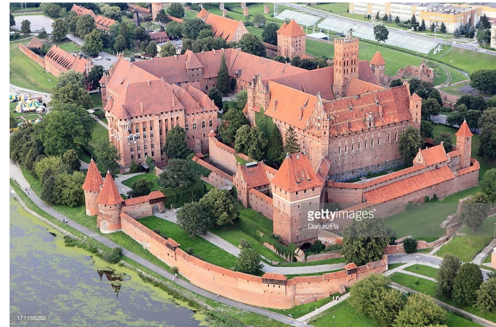
Křížácký hrad Marienburg (Malbork, Polsko) - největší cihlová stavba světa