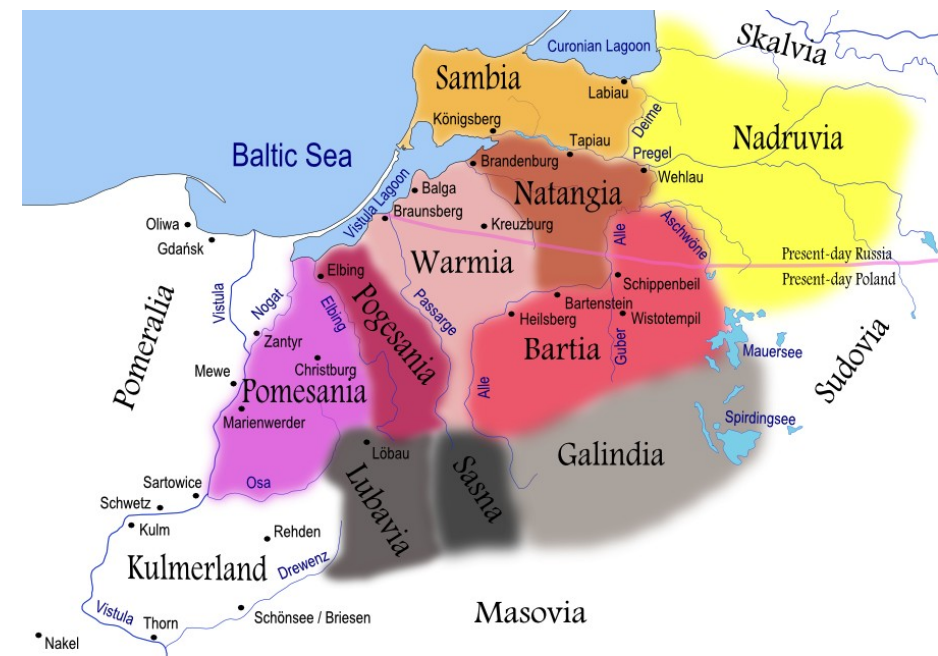
Kmenová území starých Prusů