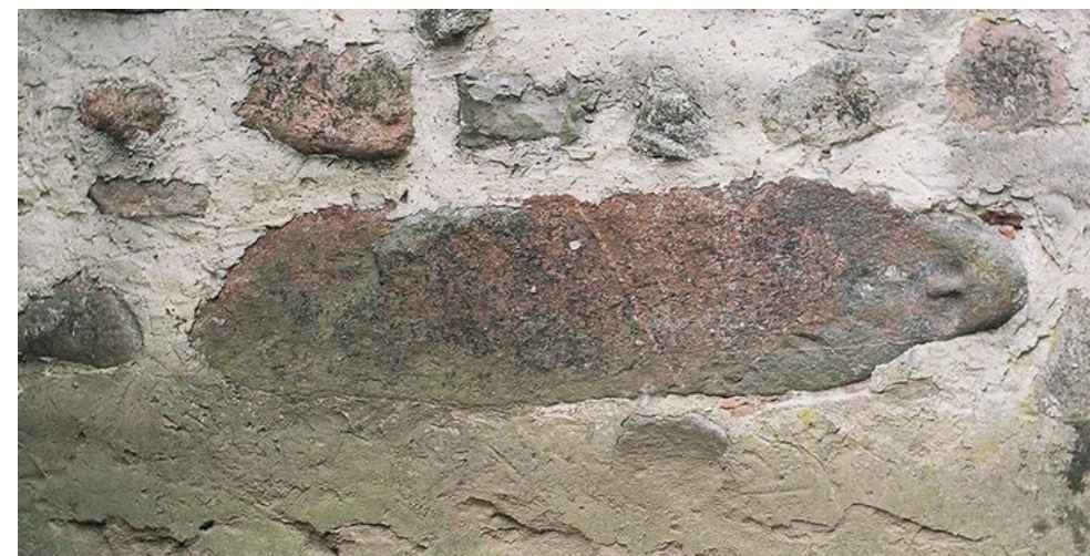
Pruský idol ve zdi kostela v Pratnici (Varmijsko-mazurské vojvodství, Polsko)