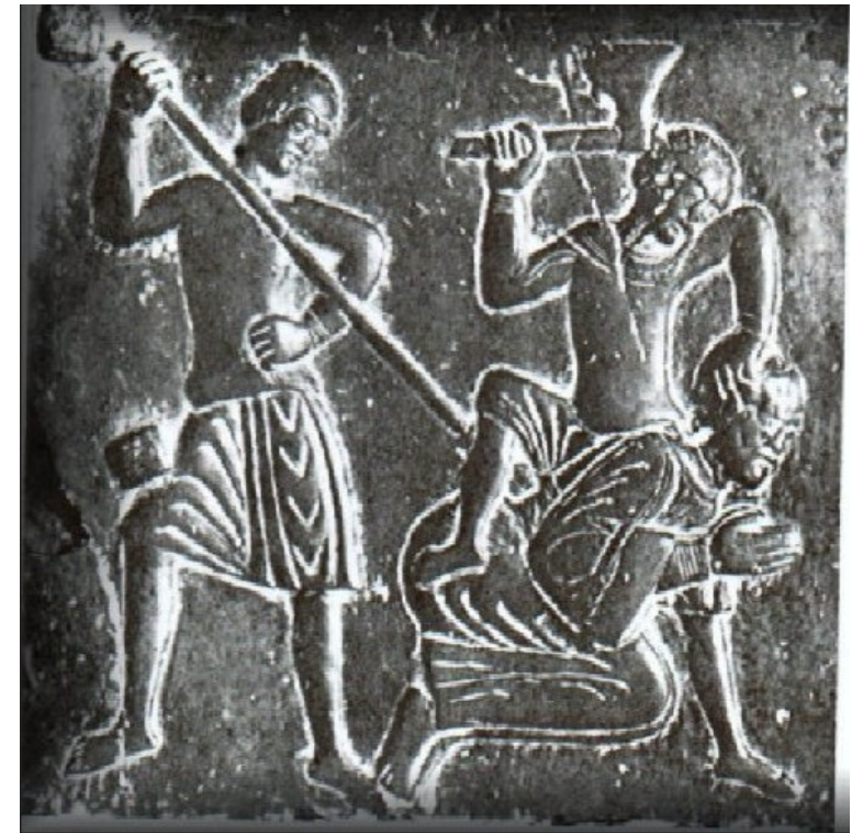
Kázání sv. Vojtěcha Prusům a jeho vražda (brána katedrály v Hnězdně)