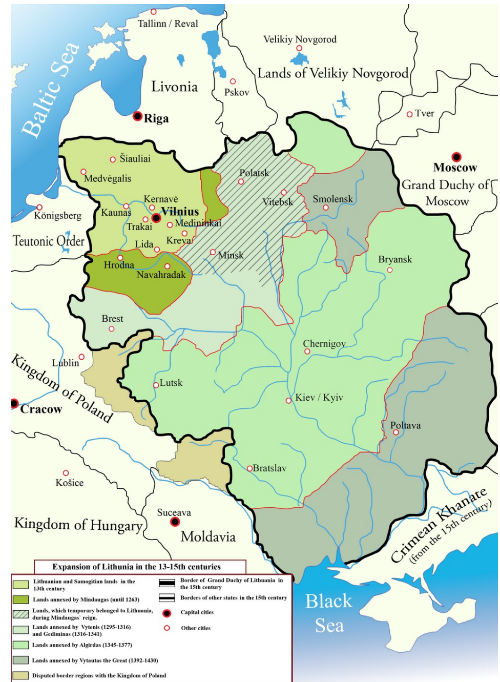
Expanze Litevského velkoknížectví 13.-15. století

3) válečná kultura + obeznámenost s taktikou řádu (v bojích v Prusku i Livonsku);