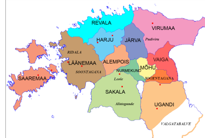
Kmenová území v Estonsku