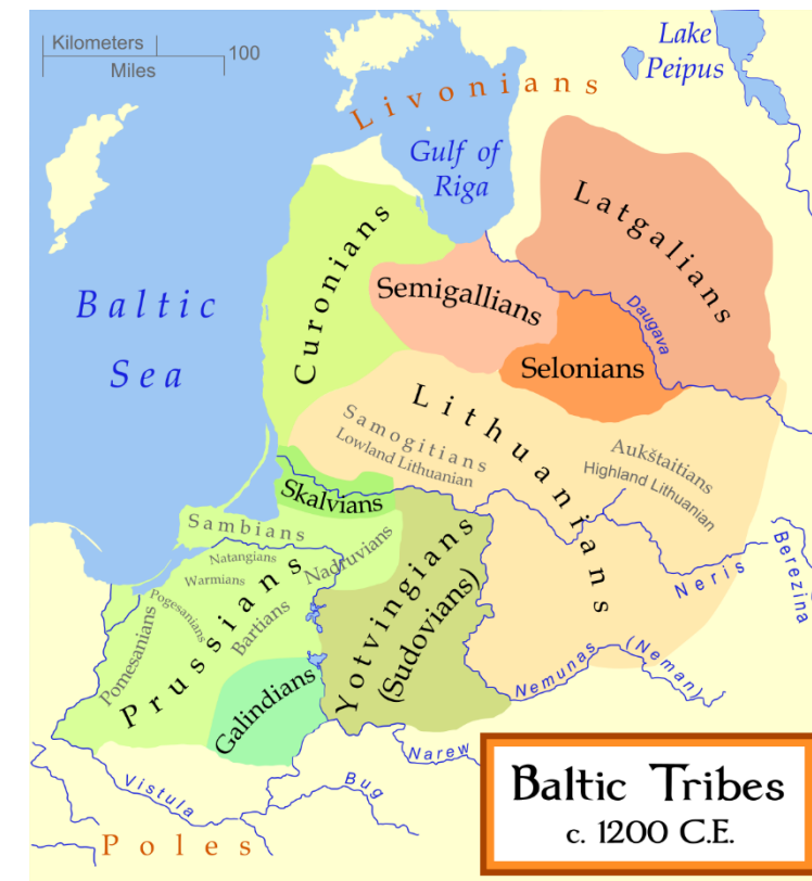
Kmenová území v baltských zemích