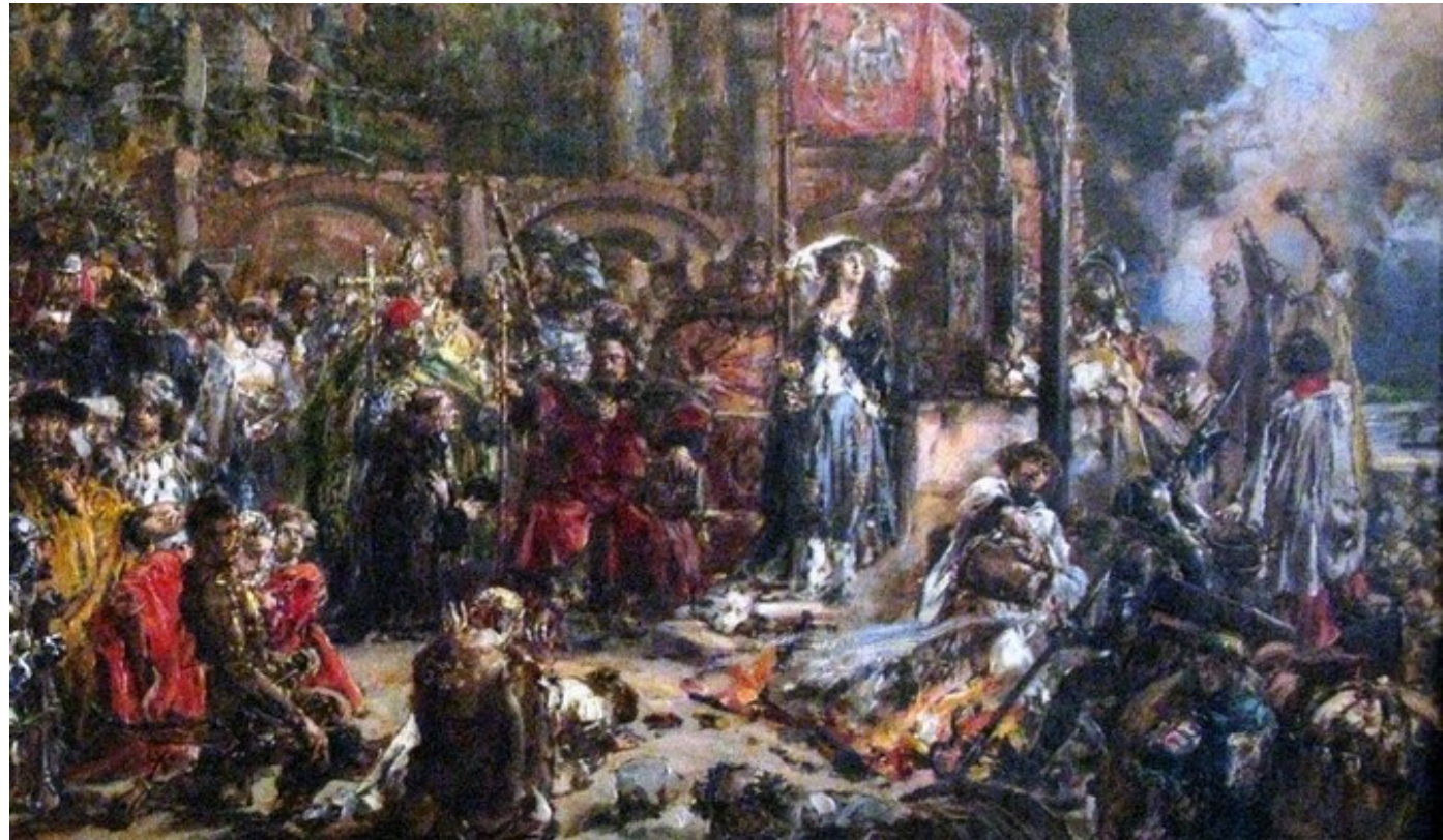
Křest Litvy (Jan Matejko, 19. století)