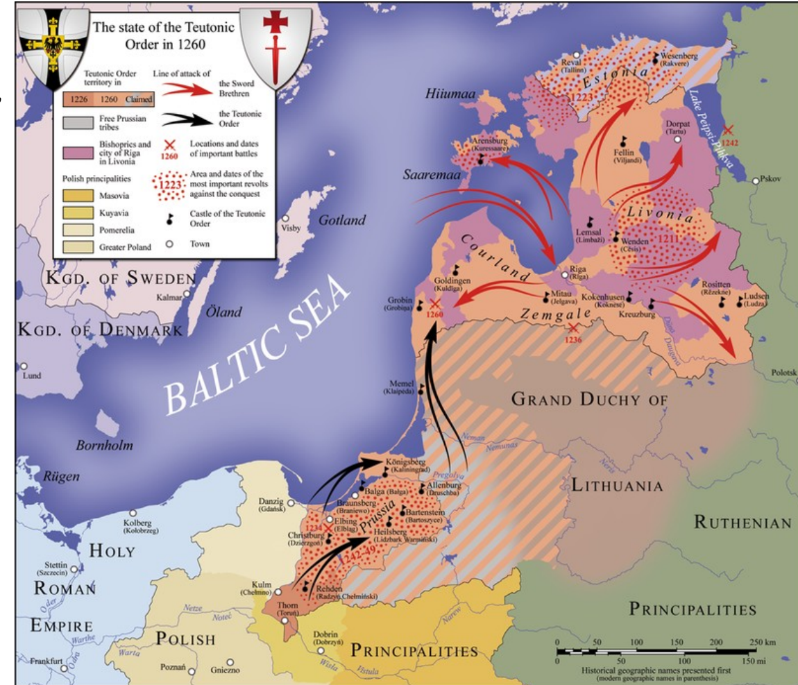
Litevské velkoknížectví – pohanský „klín“ mezi Livonskem a Pruskem