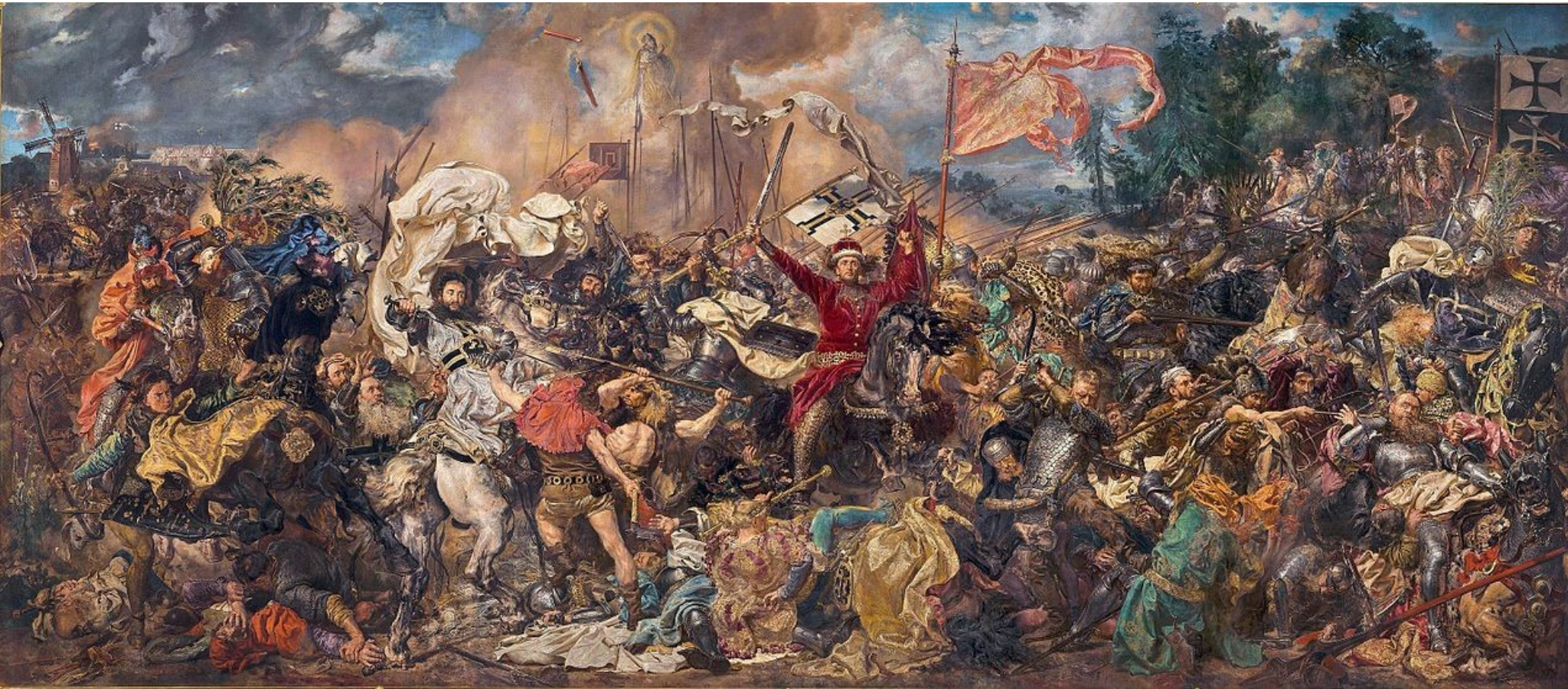
Bitva pod Grunwaldem (Jan Matejko, 19. století)