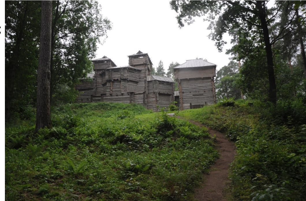
Rekonstrukce dřevěné pevnosti starých Baltů

2) náboženská perspektiva pohanů - přítomnost a počínání misionářů uráží božstva = vymytání „boha Sasů“ ze země, smývání křtů ve vodách Daugavy, očistné rituální hostiny s předky, rituální vraždy misionářů;