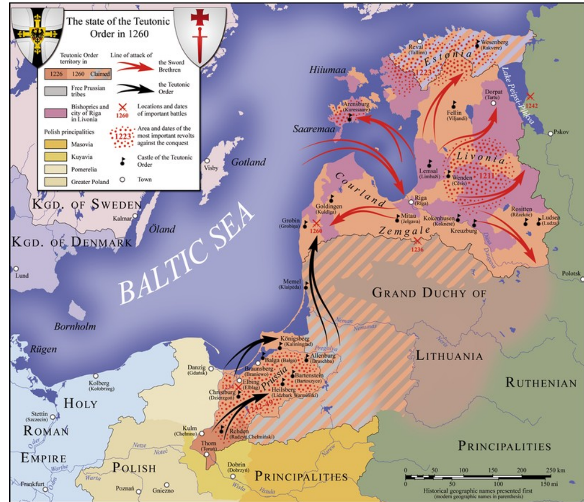
Operace Mečových a Německých rytířů v Livonsku a Prusku (13. století)