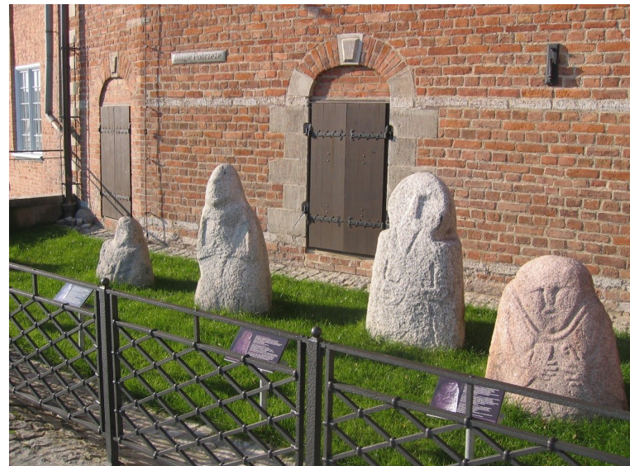
Pruské idoly v Gdaňsku (tzv. baby pruskie)