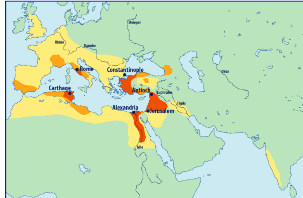
Expanze křesťanství 250-400 n.l.