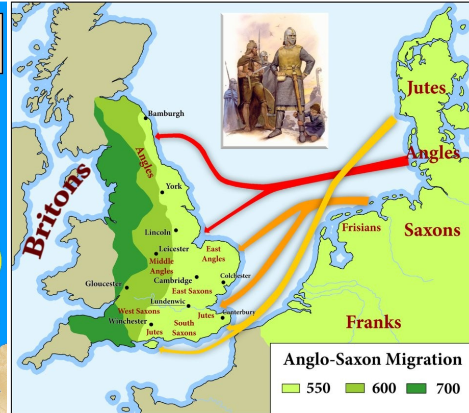
Expanze Sasů, Anglů a Jutů 400-700 n.l. (vpravo)