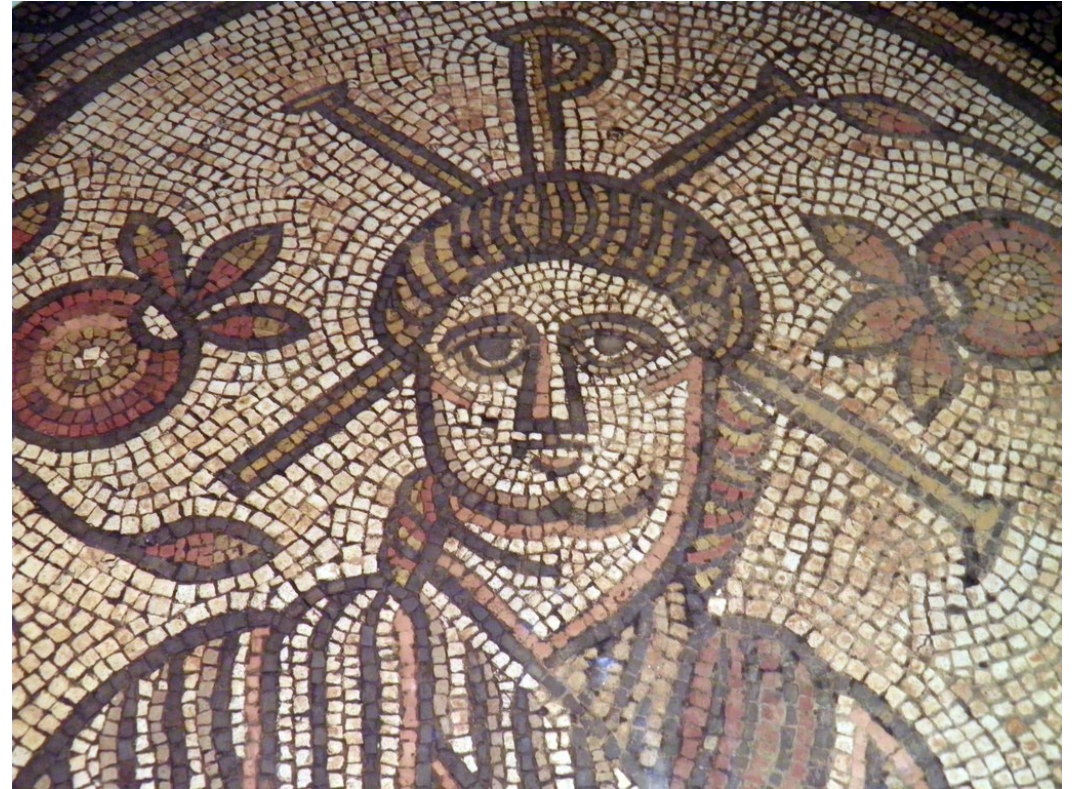
Hinton St Mary, Dorset, Anglie 4. století

429 přijíždí sv. Germanus potlačovat pelagiánství - přijat "skvěle oděnými" britskými králi (dílo Vita Germani)