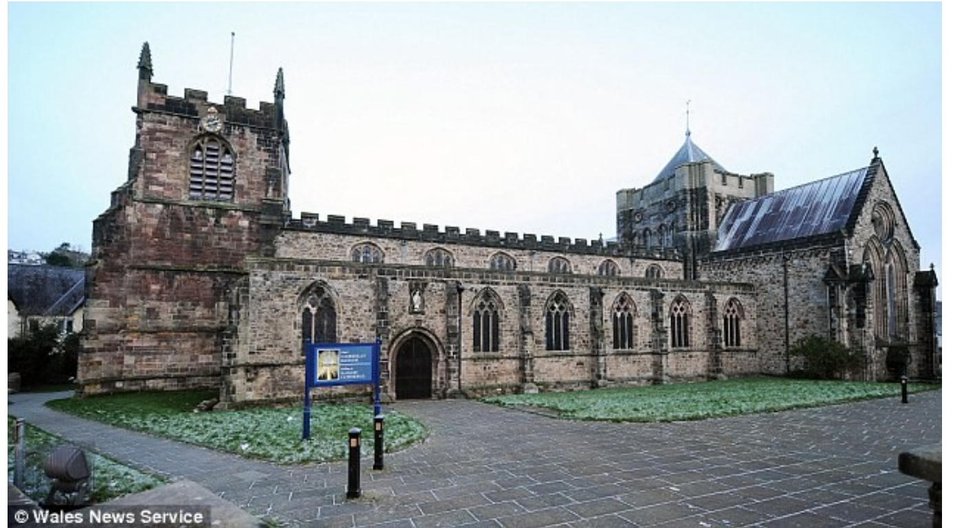
Katedrála ve velšském Bangoru – součást zaniklého kláštera