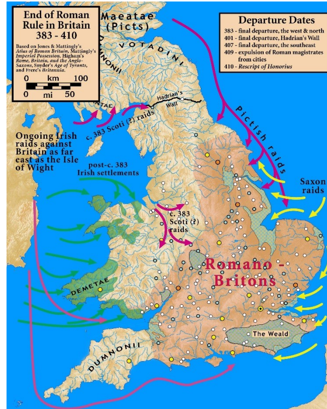
Romanizace Británie před 410 n.l. – předpokládaný rozsah (vlevo)