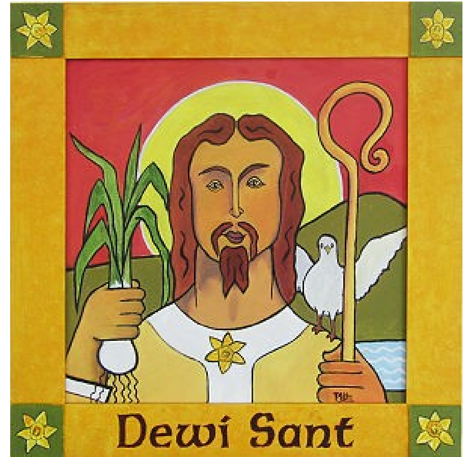
sv. David (atributy holubice a pórek) – moderní portrét