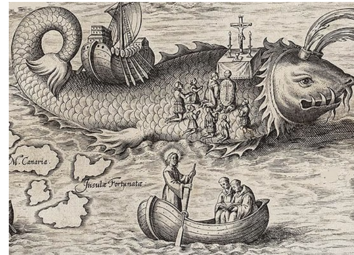
Mniši sv. Brendana večeří na hřbetě velryby