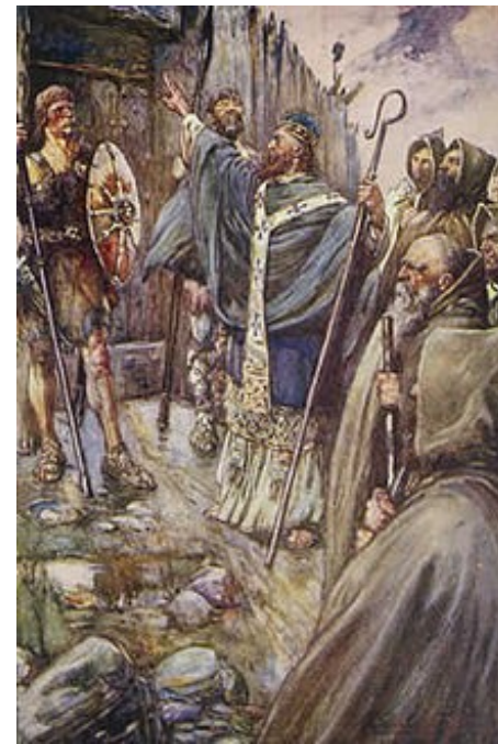
Kolumba u pevnosti piktského krále Bridea