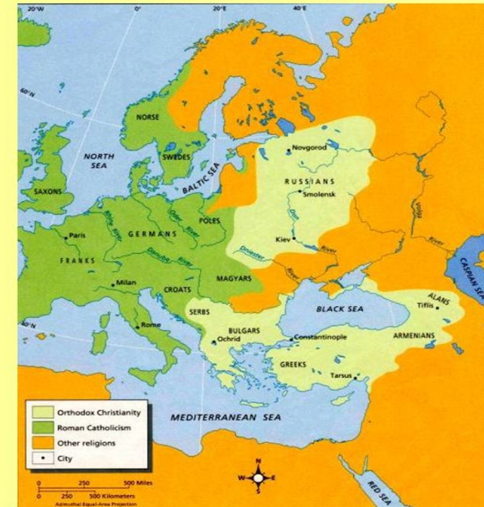
Náboženská situace v Evropě kolem 1150