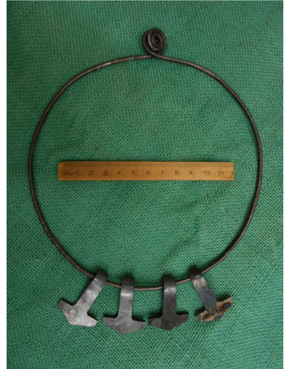
Amulety boha Tóra-Peruna z 9. století (Gnězdovo, Rusko)