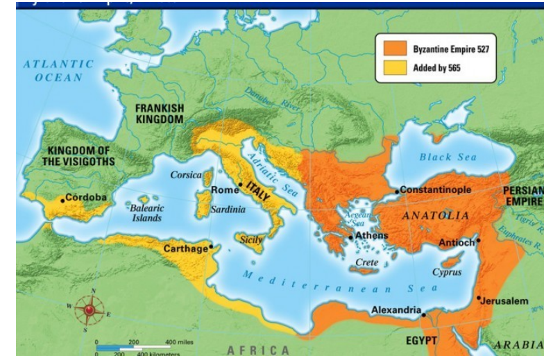
Expanze Byzance za Justiniána I. 527-565

15. století – Turci dobývají Byzanc = konec organizovaných misíí