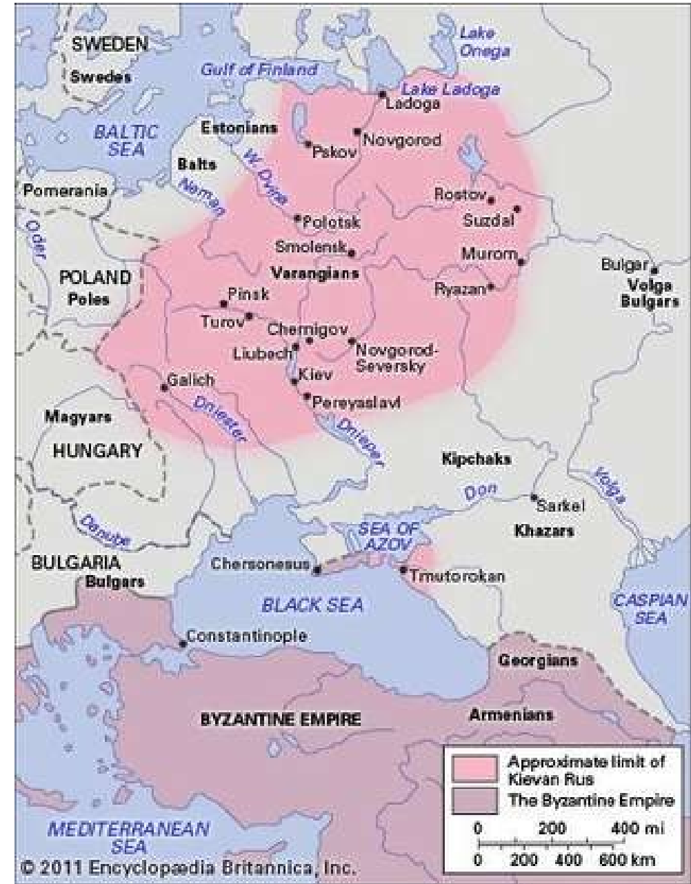
Kyjevsko-novgorodská Rus 9.-11.století