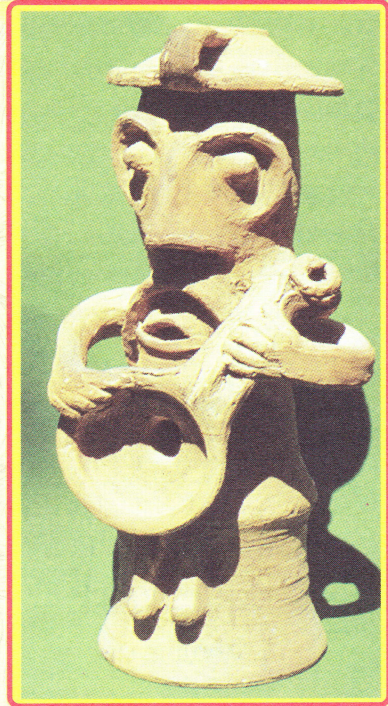
Бандурист. Статуетка із глини

ріжкування — техніку розпису різнобарвними глинами по підсушеній поверхні. Іншими центрами гончарства в Україні стали Хуст (Закарпаття), Дибинці (Богуславський район Київської області), Адамівка (Хмельницька), Бубнівка, Бар, Смотрич