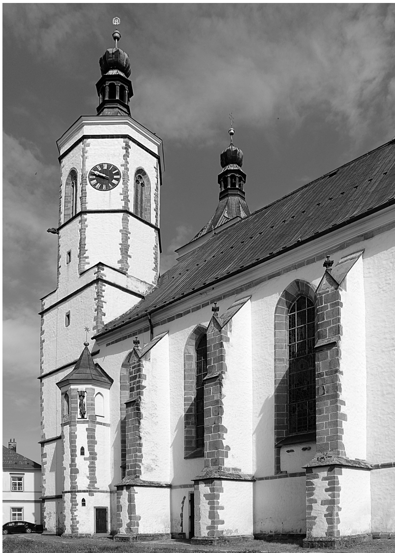
Obr. 6. Exteriér kostela Nanebevzetí P. Marie v Uničově představuje cenný doklad vrcholně gotické sakrální architektury. O stáří stavby byly mezi historiky umění vedeny diskuse; nejnovější bádání klade zahájení stavby již před konec 13. století (Dalibor Prix).