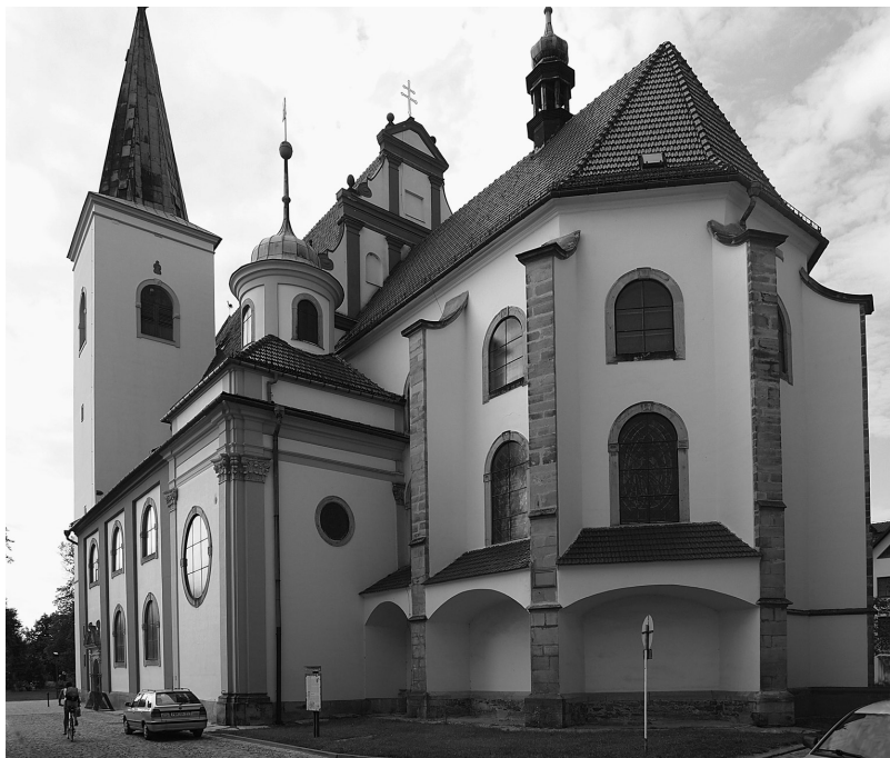
Obr. 2. Farní kostel sv. Marka v Litvňovicích navzdory raně barokní přestavbě ve své hmotě dosud uchovává podstatnou část pozdně gotické stavby z druhé poloviny 15. století.

z konce 12. století. Rozsáhlé archeologické výzkumy v prostoru Starého Města sice ukázaly, že tamní kostel sv. Filipa a Jakuba vznikl až koncem 14. století a nemá kamenného předchůdce, na druhé straně však byly nalezeny určité indicie pro existenci sakrální stavby v jiné poloze: ve trati Starý hřbitov, asi 100 m severozápadně od kostela sv. Filipa a Jakuba, byl nalezen úlomek terakoty, která by dle Pavla Šlézara mohla pocházet např. ze sloupku chórové přepážky a je datovatelná nejpozději do přelomu 12. a 13. století. 24