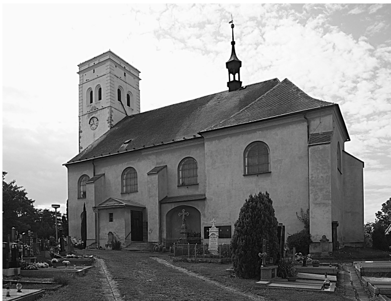
Obr. 3. Zatímco hlavní loď a věž kostela sv. Petra a Pavla v Medlově představují typickou ukázkou renesanční sakrální architektury, presbytář je jednoduchou raně gotickou stavbou asi ze 70.–80. let 13. století. Zatím nebylo zjištěno, zda kostel měl románského předchůdce.

Ať již se existenci kostela na Starém Městě již kolem roku 1200 podaří prokázat, nebo nikoliv, vzhledem k pozdějšímu vývoji se zdá být vysoce pravděpodobné, že tato osada byla od počátku podřízena faře v Medlově. To by ovšem znamenalo, že by medlovský kostel sv. Petra a Pavla, resp. jeho předchůdce musel pocházet již z 12. století, což zatím nebylo archeologicky ani stavebně historicky doloženo, neboť dnešní svatyně je v jádře raně gotická stavba asi ze sedmdesátých až osmdesátých let 13. století; 25 je to však každopádně dobře možné (obr. 3).