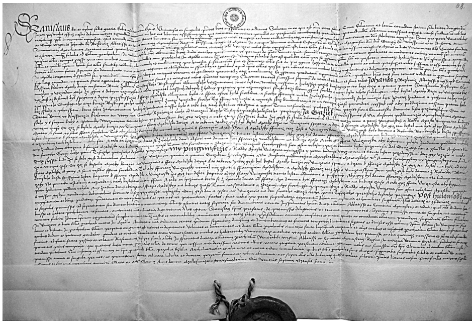
Obr. 4. Originál dimmembrační listiny olomouckého biskupa Stanislava Thurza ze 7. června 1510, Olomouc, pro uničovský farní kostel Nanebevzetí P. Marie. Zemský archiv v Opavě – Státní okresní archiv Olomouc, fond Archiv města Uničova, inv. č. 60.

v Litovli, i nyní se prostě uvádí, že uničovský kostel Nanebevzetí P. Marie byl až doposud podřízen farnímu kostelu v Medlově. Na rozdíl od Litovle se sice uničovský filiální kostel v dimmembrační listině neoznačuje výslovně jako farní, nicméně se zdůrazňuje, že oba kostely – farní v Medlově i filiální v Uničově – měly již dlouho svého vlastního plebána a duchovního pastýře („iam multis annorum intervallis tam parochialis in Medla mater, quam eciam in Vniczow filialis, hoc est quelibet earum, per se proprium plebanum suum et pastorem animarum habuissent et habere consuevissent“). Oba plebáni přitom byli i se svými pomocnými kleriky vyživováni z výnosů toho kostela, u něhož působili, takže osamostatnění uničovské fary, o něž petenti biskupa žádají, nepřinese