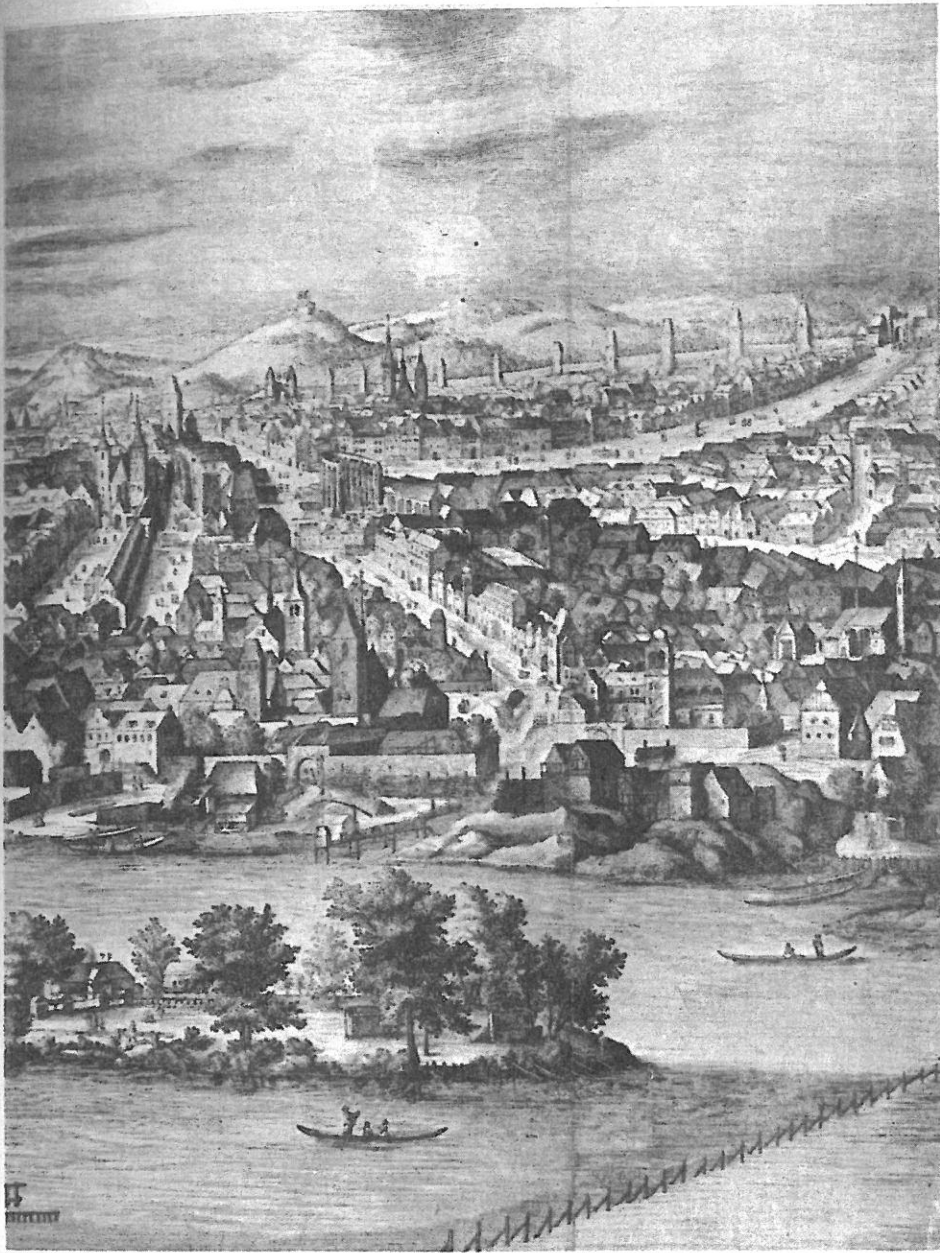
Část Starého a Nového Města pražského. Rytina J. Sadelera z r. 1606.

málo tehdy v slyšení uvedli, vybírajíce předkládali pouze body, které byly pobuřující.