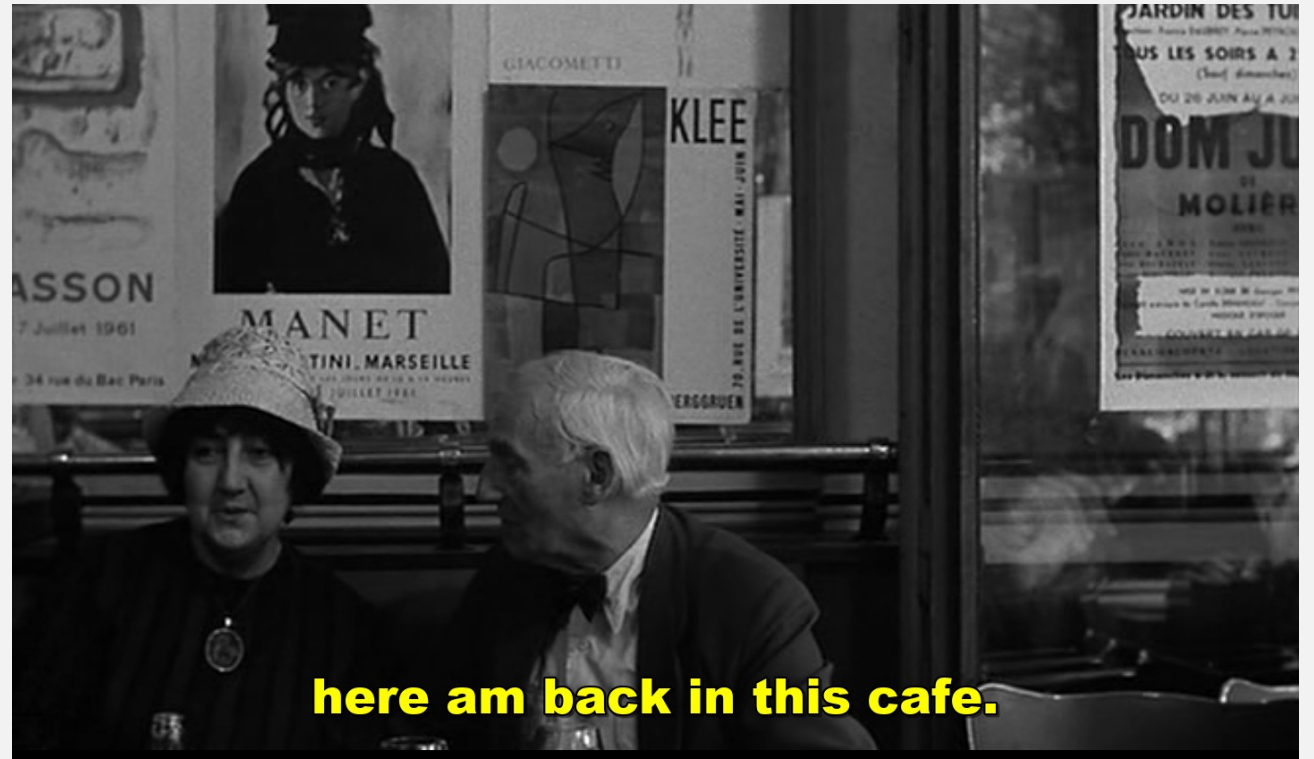
here am back in this cafe.