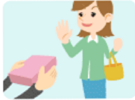
Refuse (リフューズ) いらないものはもらわない。