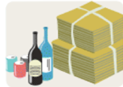
Recycle (リサイクル) 再生利用する。