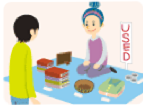
Reuse (リユース) 繰り返して使う。