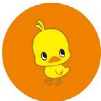
チキンラーメン ひよこちゃん