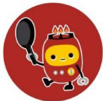
ロボットコンロ チリチリ