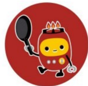
ロボットコンロ チリチリ