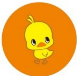
チキンラーメン ひよこちゃん