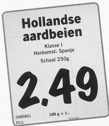
Bord bij Lidl