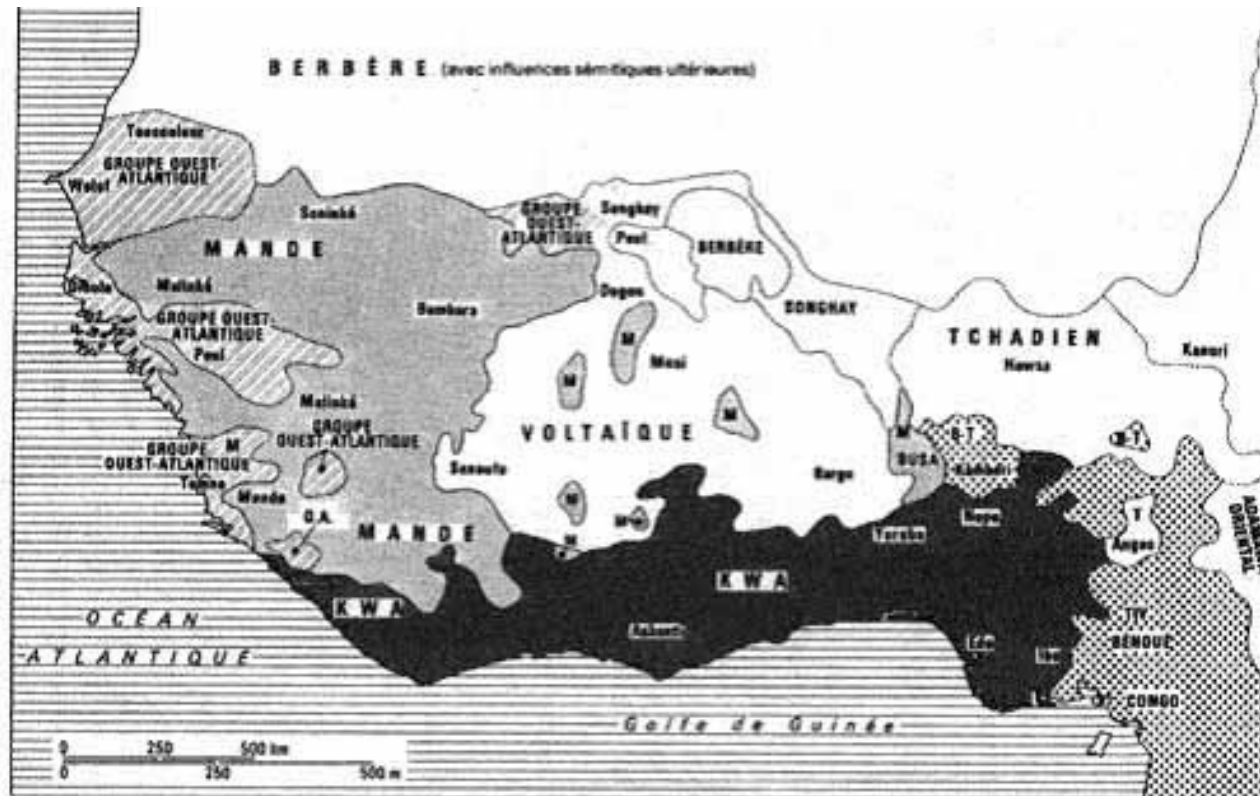
18.1. Familles linguistiques d'Afrique de l'Ouest (carte simplifiée indiquant certaines des langues principales).