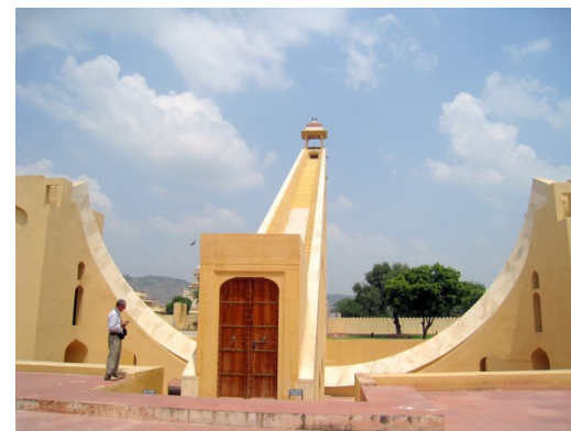
observatoř Jai Singh http://farm4.static.flickr.com/3063/2945345304_69141cea0f_o.jpg