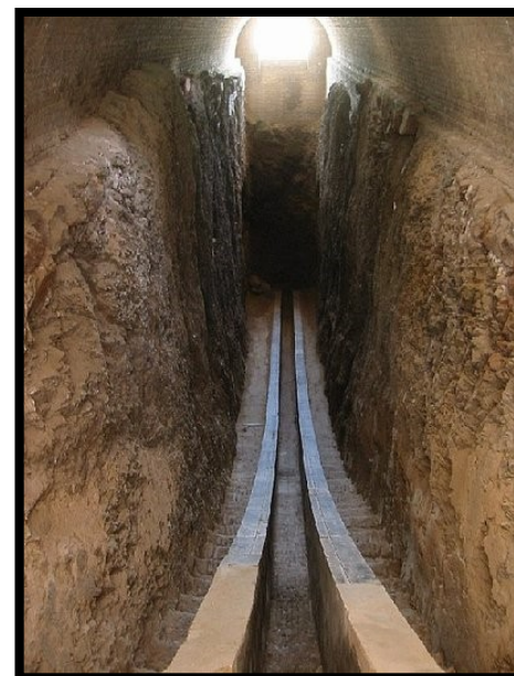
observatoř v Ulugh Beg