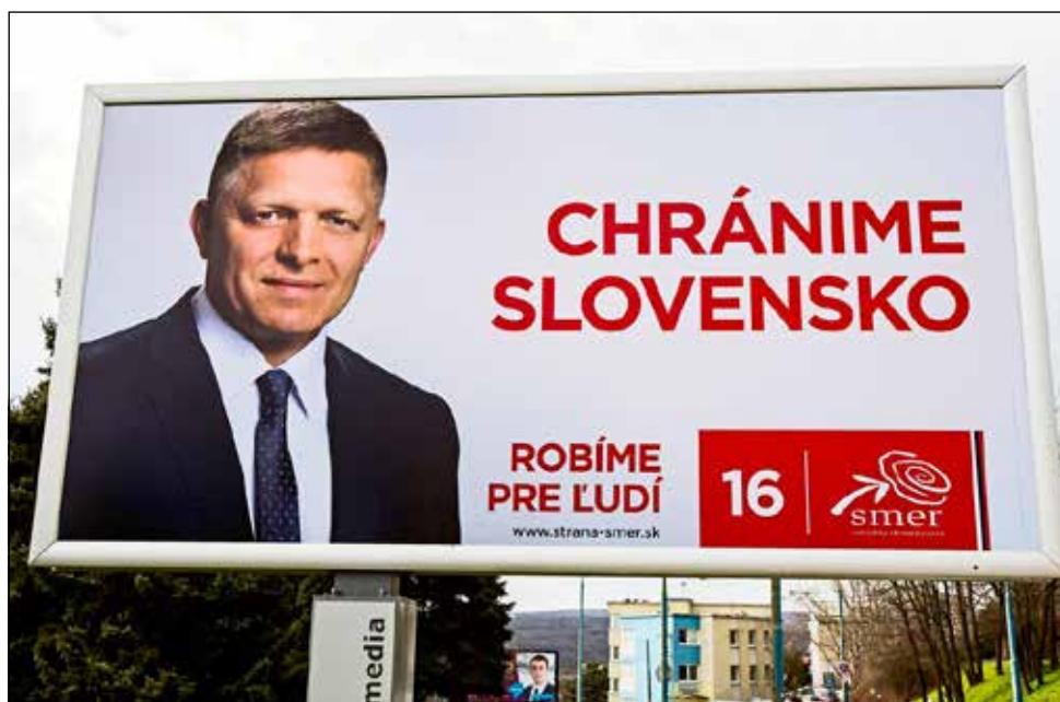
Billboard vo volebnej kampani strany Smer-SD. 2016. Zdroj: Odborník hodnotí..., 2016.

Viacere vedúce politické strany deklarovali voči migrantom jasne nepriateľský postoj. Analýzu diskusie, ale i reálnych politických krokov prinášajú v tejto súvislosti viaceré štúdie. 21 Vedúcu úlohu v diskusii, ale i reálnych politických krokoch zohrávala podľa nich strana Smer-SD, pre ktorú bol príznačný odpor voči umiestneniu utečencov na Slovensku na základe povinných kvót, spájanie utečencov s terorizmom a tvrdenie, že utečenci z Blízkeho východu a Afriky sa nedokážu v Európe integrovať vzhľadom na islámske náboženstvo. Už v roku 2004 označil minister vnútra stúpajúce číslo migrantov za veľký „problém“, ako aj za „bezpečnostné a kultúrne riziko“ pre našu krajinu. 22 V polovici októbra 2015 zmenila strana dokonca aj svoje hlavné volebné heslo z „Robíme pre Slovensko“ na „Chránime Slovensko.“ 23 Ohrozenie európskeho spôsobu života, zaistenia bezpečnosti a potencionálne riziká vzťahoval Smer najmä k muslimom ako takým, ale i muslimom a muslimskej komunite na Slovensku. 24 V prejavoch premiéra Roberta Fica je v tomto období prítomné množstvo emocionálnych a hyperbolických jazykových konštrukcií, ktoré evokujú „morálnu paniku“ z príchodu migrantov, tiež výroky o monitorovaní všetkých muslimov na Slovensku. 25 Vyhranený politický názor k téme zastávala Slovenská národná strana, ktorá prezentovala striktne anti-imigrantský postoj, založený na potrebe chrániť krajinu pred cudzími a najmä muslimskými vplyvmi a snahe zachovať jej pôvodný (kresťanský) charakter. Strana navr-