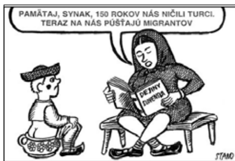
Vtípy o migrantoch na sociálnych sieťach. 2019.

hovala zmeniť nelegálny prechod vonkajších hraníc schengenského priestoru z priestupku na trestný čin, zvýšiť trestné sadzby voči prevádzkačom, sprísniť zákon pri registrovaní nových cirkví a náboženských spoločností a prijať zákon o zamedzení nosenia burky a výstavby mešít a minaretov. K podpore predvolebnej kampane využívali tému migrácií výrazne aj predstavitelia pravicovo-extremistickej strany Ľudová strana Naše Slovensko. Táto strana zastávala politiku tzv. nulového prisťahovalectva, migráciu spájala s kriminalitou, terorizmom, odmietala inte-