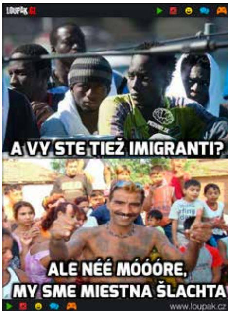
Vtipy o migrantoch na sociálnych sieťach. 2019.

Zaujímavou témou, ktorá sa viaže predovšetkým s internetovým mediálnym prostredím a sociálnymi sieťami, je šírenie nepodložených informácií o migrantoch a migráciách, ktoré majú povahu konšpirácií, hoaxov, karikatúr, vtipov či fám. Fámou nazývame tvrdenie, ktoré nevychádza z overených informácií, odvoláva sa však na svedkov udalosti, konkrétne zdroje, ktorými sú neraz authority alebo osoby, ktoré poznáme. Dej fámy je obyčajne aktuálny, pravdepodobný, šokujúci a vyvoláva pocit, že nám zasahuje do života. Médiami sa v tejto súvislosti šírili napríklad informácie o desivých podmienkach v utečeneckých táboroch, o strastiplných pokusoch ilegálnych migrantov, o stratách na životoch a obetiach, o obrovskom počte utečencov v Európe a na Slovensku, invázii muslimov, o rabovaní, znásilňovaní, ničení kresťanských tradícií, svetovej vojne, fyzickom ohrození, sexuálnych útokoch, terorizme. Ústrednou témou sa stali muslimovia a muslimská kultúra, ktorá boli zobrazovaná ako nepriateľská. Podľa