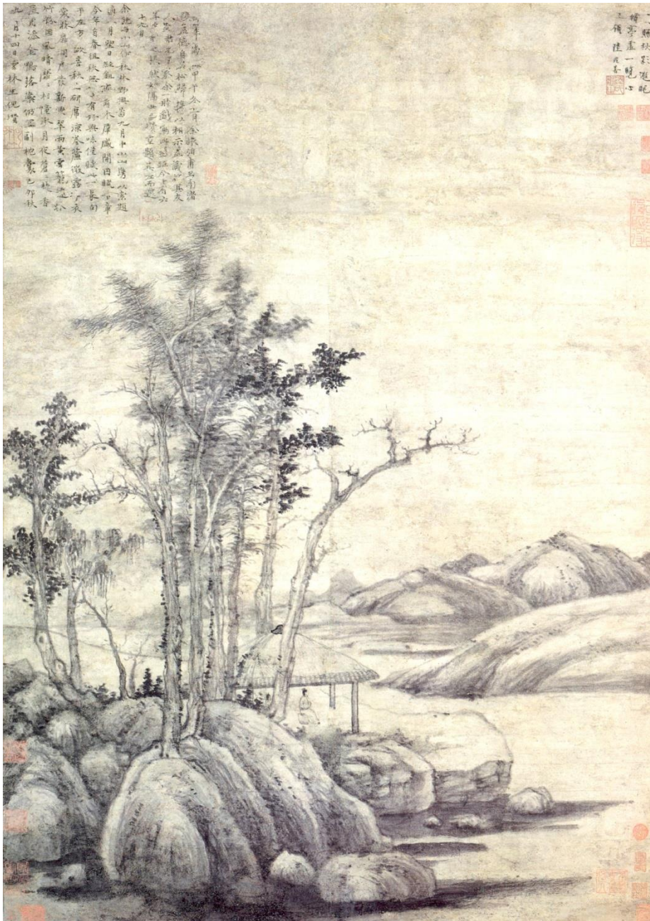
Ni Can, Potěšení z přírody v podzimním hájku, 1339