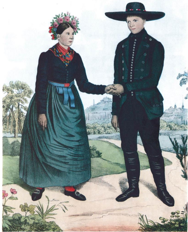
SVOBODNÝ PÁR Z KOMÁROVA