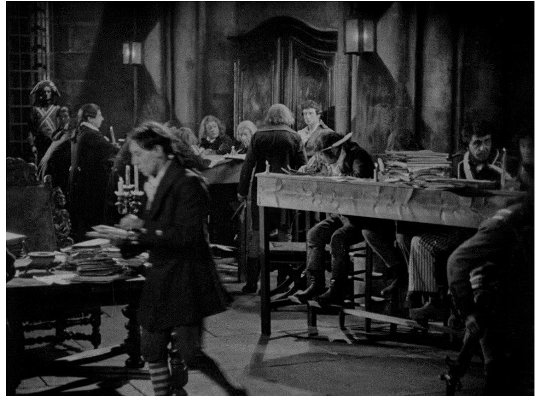
Tristanova role jako přepisovatele během období robespierovského teroru