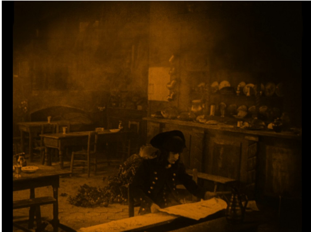
Napoleonův příchod do hostince, kde obsluhuje Fleuriho rodina, před obléháním Toulonu