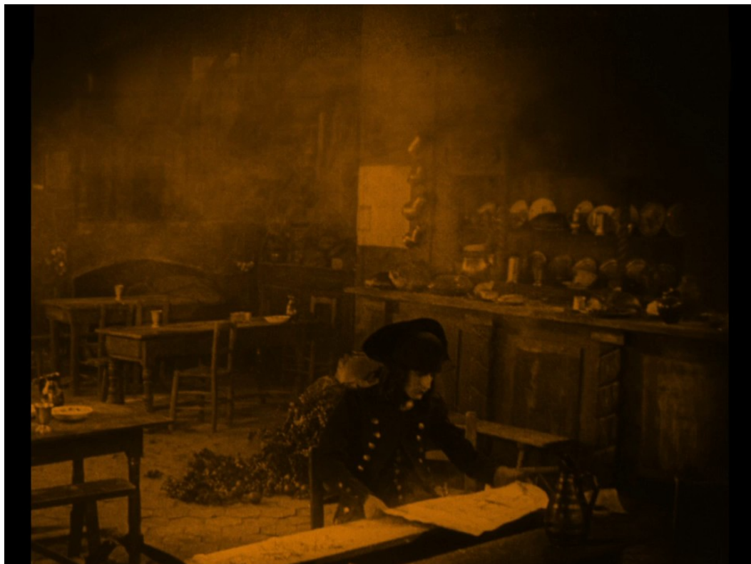
Napoleonův příchod do hostince, kde obsluhuje Fleuriho rodina, před obléháním Toulonu