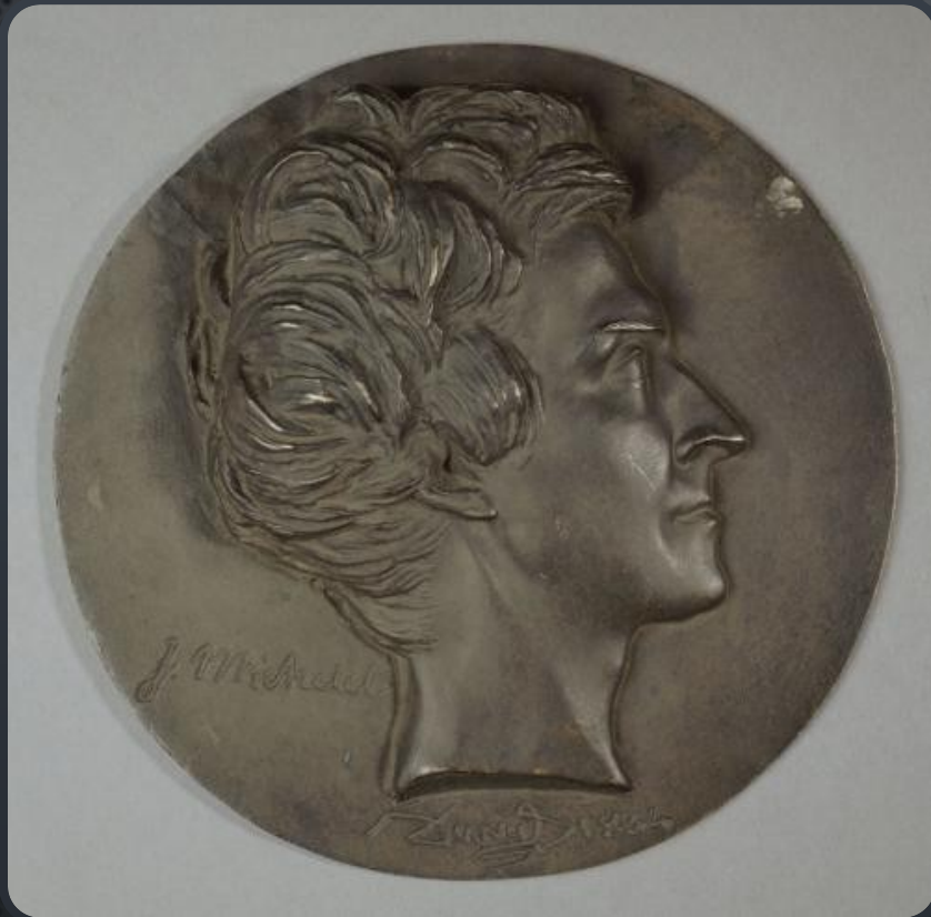
Jules Michelet, par David d'Angers