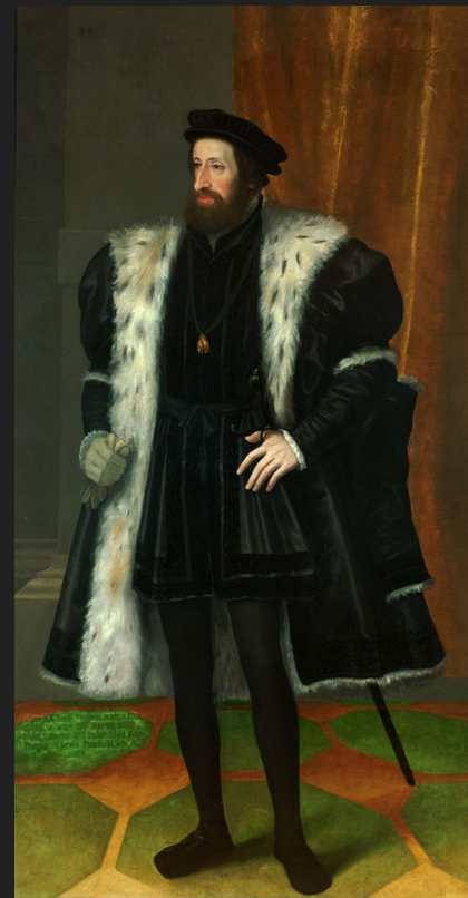
Obr. 2: Ferdinand I. Habsburský