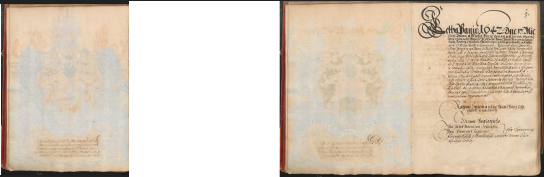
Obr. 3 a 4: Památné knihy sněmovní z let 1642-1644