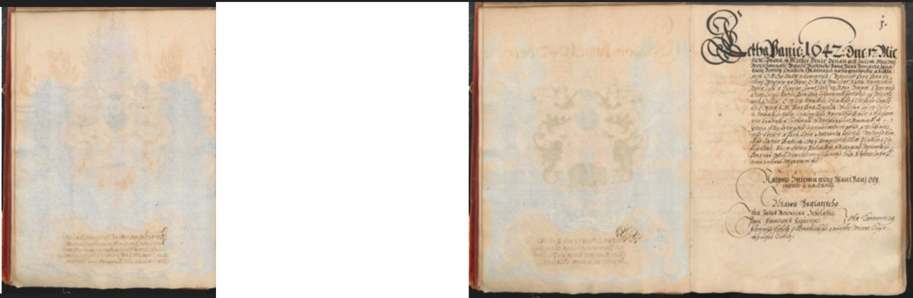
Obr. 3 a 4: Památné knihy sněmovní z let 1642-1644