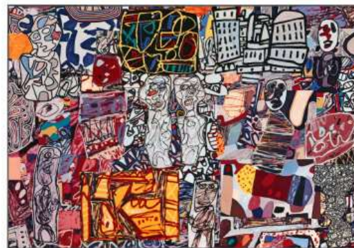
Jean Dubuffet Théâtres de mémoire THE PRICE GALLERY 32 EAST 57TH STREET, NEW YORK, NEW YORK 10022 MARCH 12 TH 1977 - APRIL 23 RD 1977